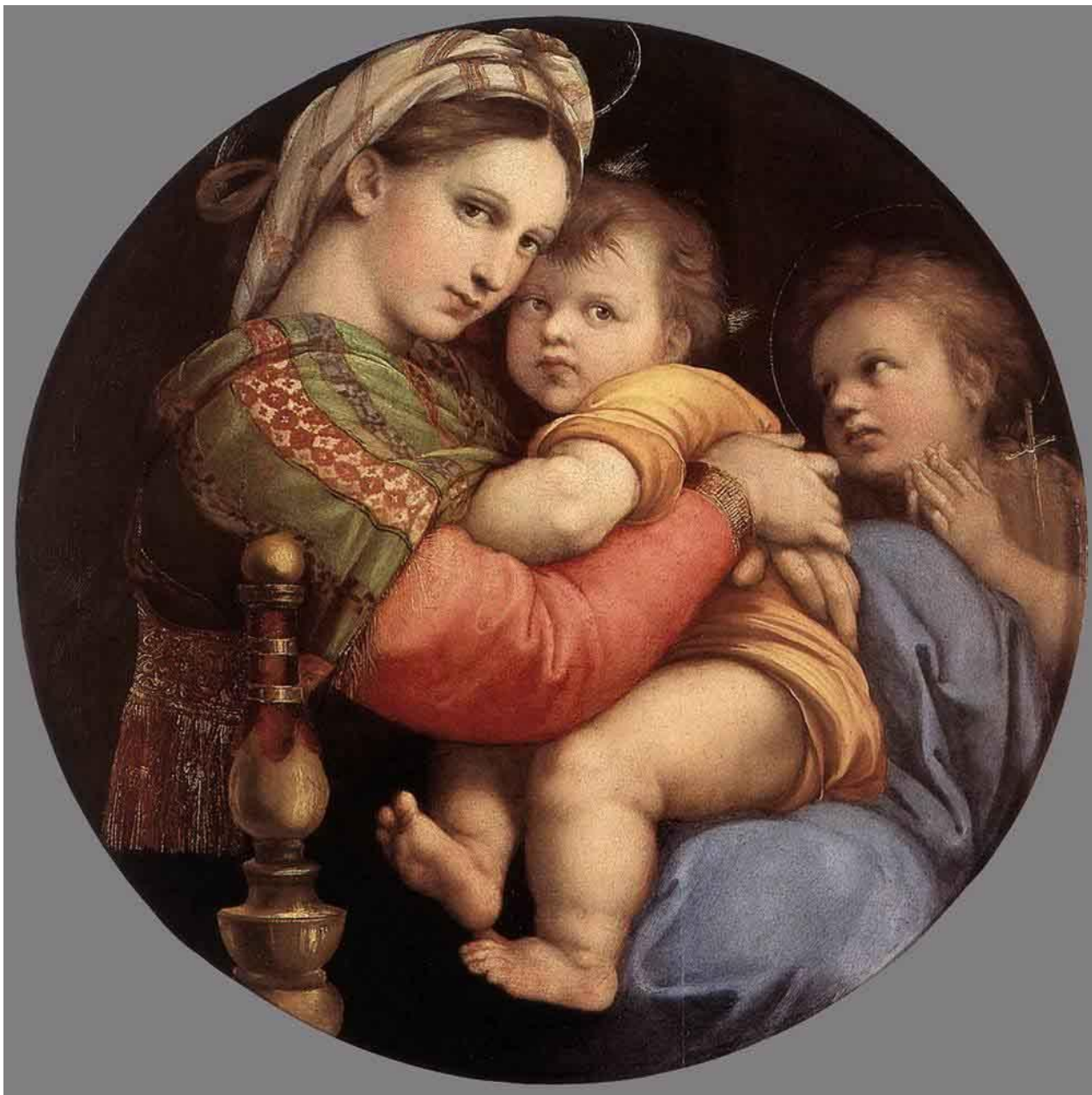
Мадонна с ребёнком. Рафаэль