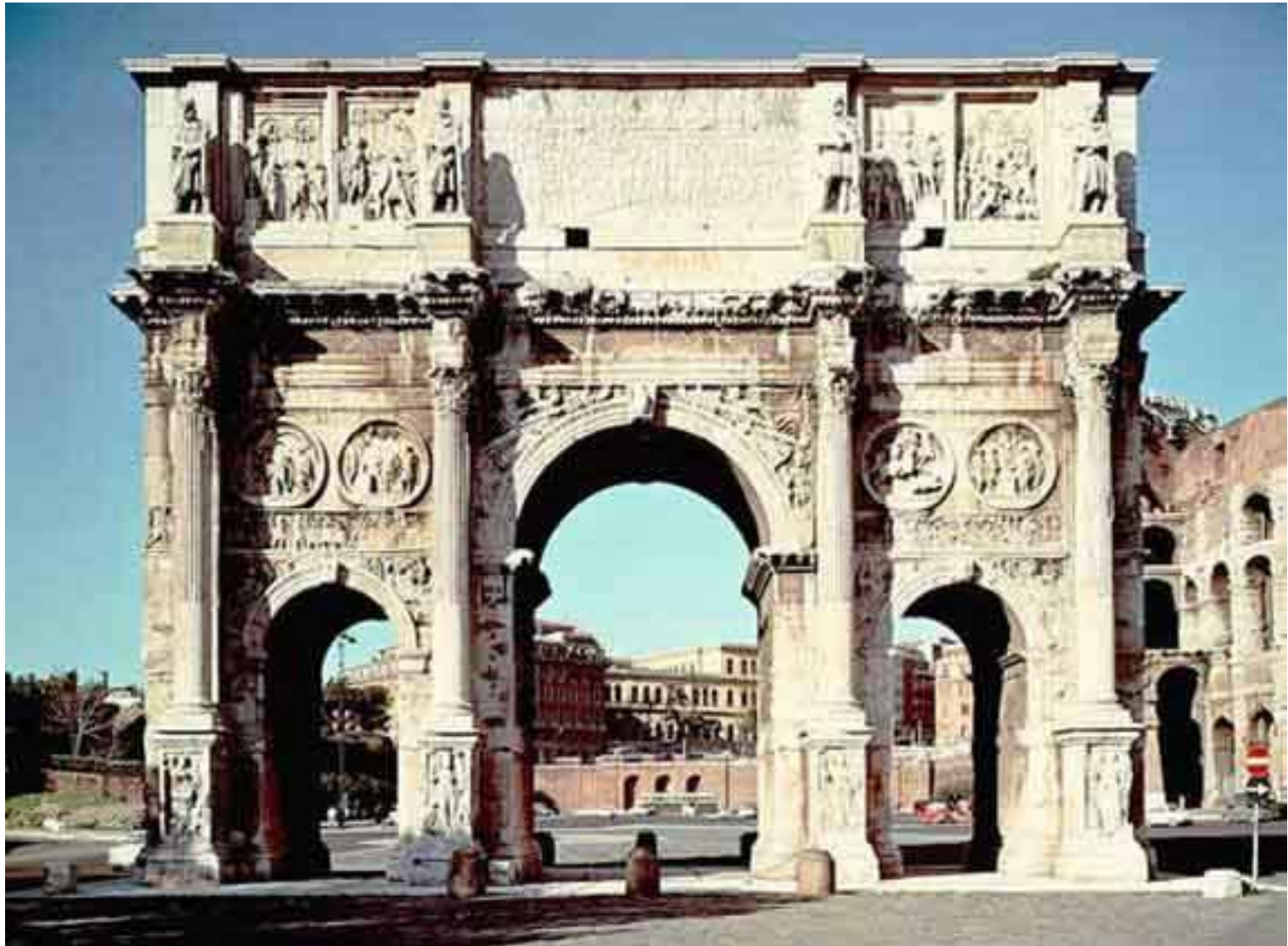
АРКА КОНСТАНТИНА (315 н.э.).