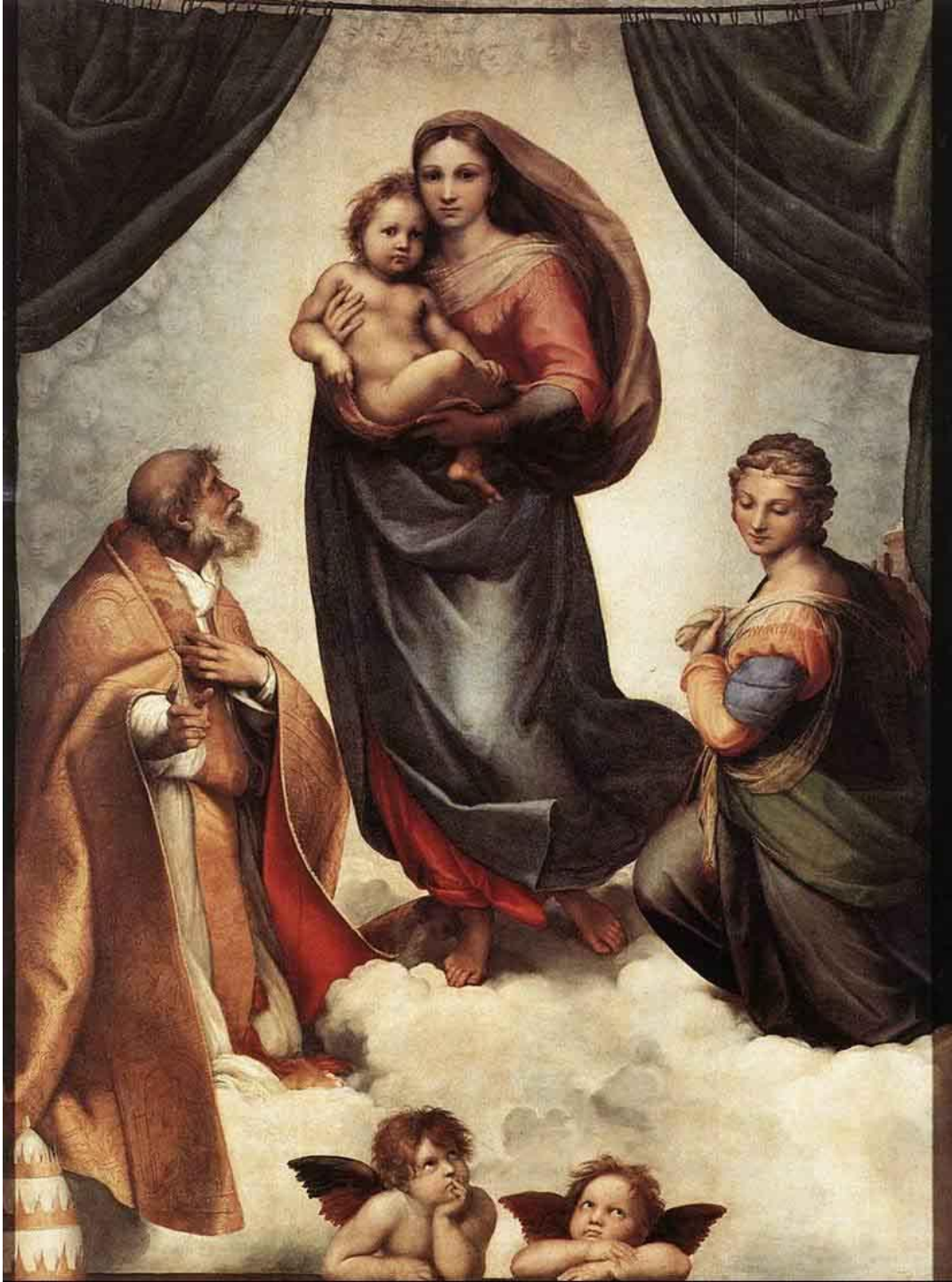
Сикстинская Мадонна. Рафаэль