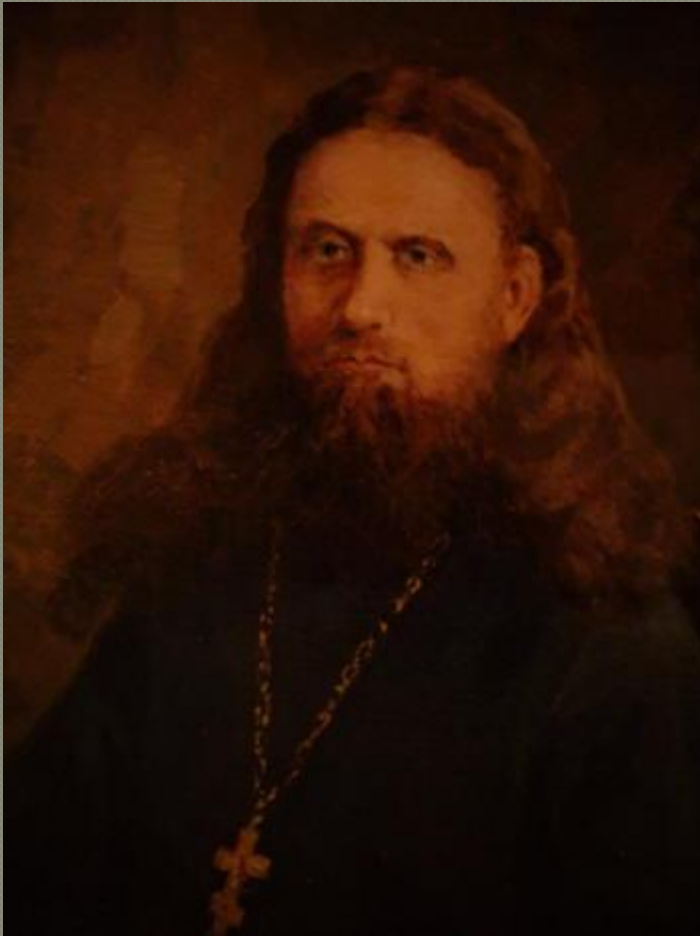
Чекалов Владимир Дмитриевич

Причислен к лику святых Новомучеников и Исповедников Российских на Юбилейном Архиерейском Соборе Русской Православной Церкви в августе 2000 г.