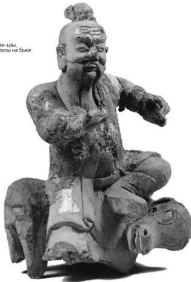
Статуэтка Лао-цзы, едущего верхом на быке Терракота. Тайвань. XIX в.