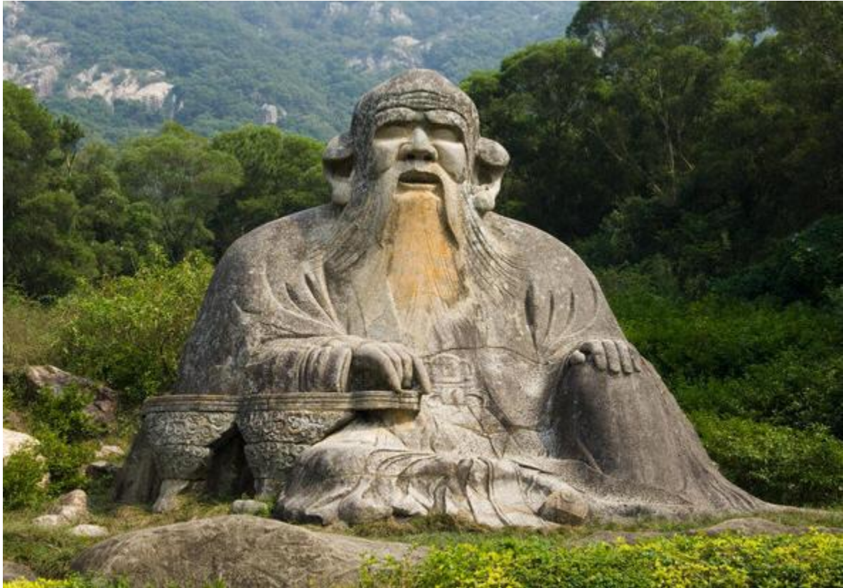
Монументальная скульптура Лао-цзы у подножия горы Цинъюаньшань, г. Цюаньчжоу, провинция Фуцзянь, XIII в.