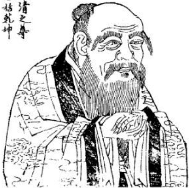
Поздний образ Лао-цзы Гравюра XVIII в.