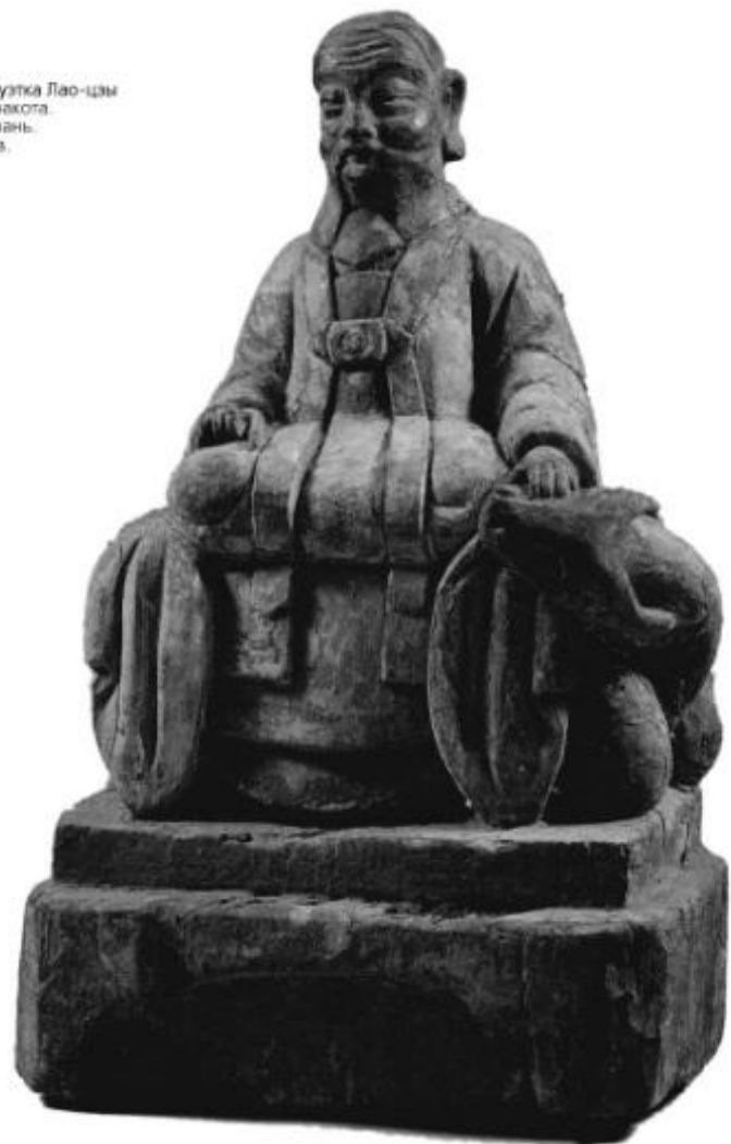
Статуэтка Лао-цзы Терракота. Тайвань. XIX в.