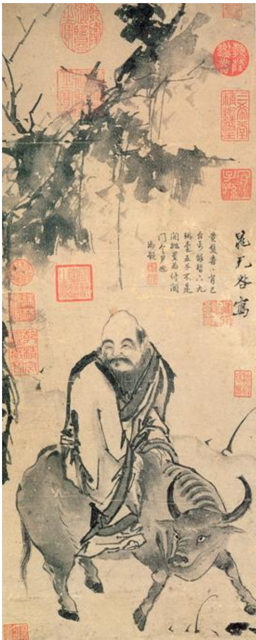
Чжао Бучжи Портрет Лао Цзы, едущего верхом на быке Рубеж XI – XII вв.