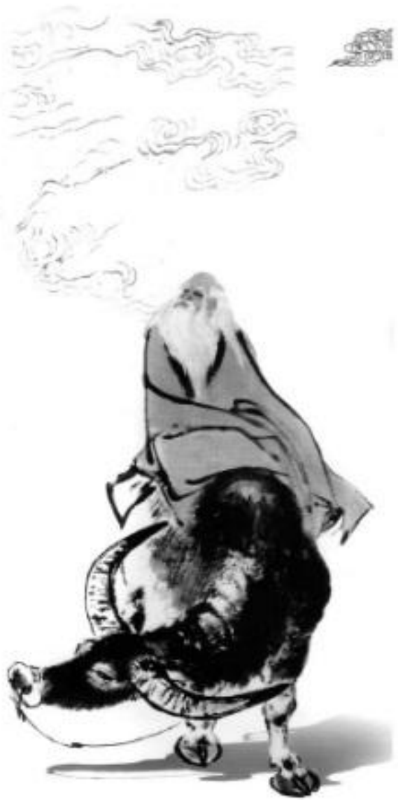
Лао-цзы Современный китайский художник