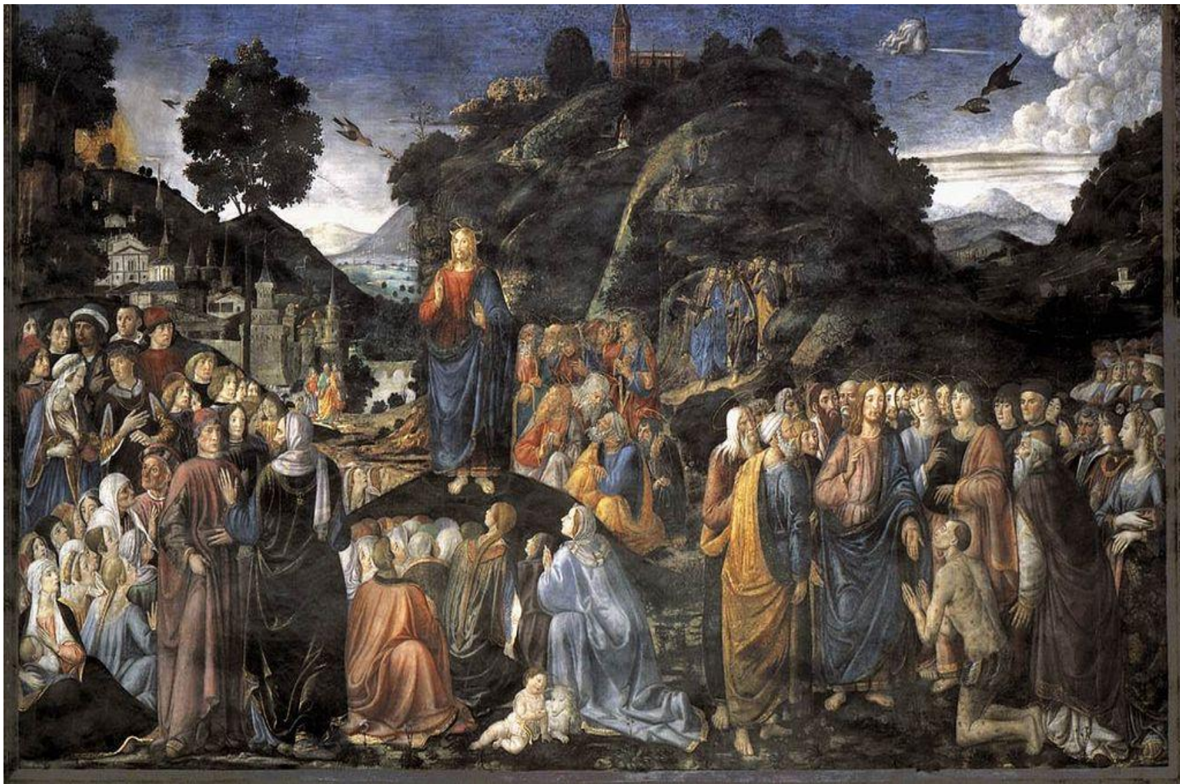
Нагорная Проповедь. Козимо Росселли. Сикстинская капелла.