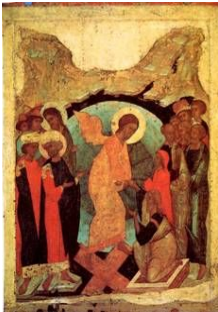
СОШЕСТВИЕ ХРИСТА ВО АД Андрей Рублев