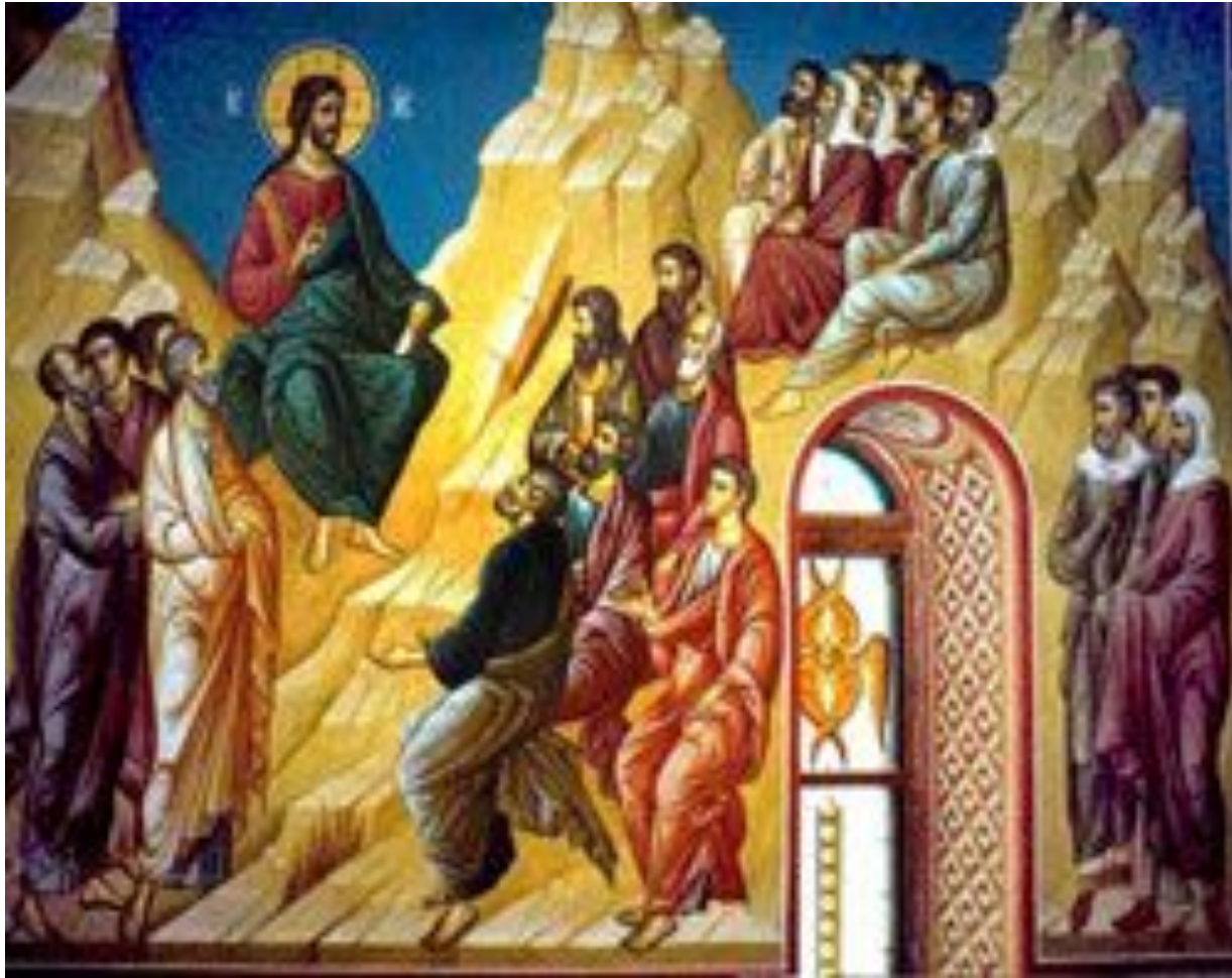
НАГОРНАЯ ПРОПОВЕДЬ ХРИСТА