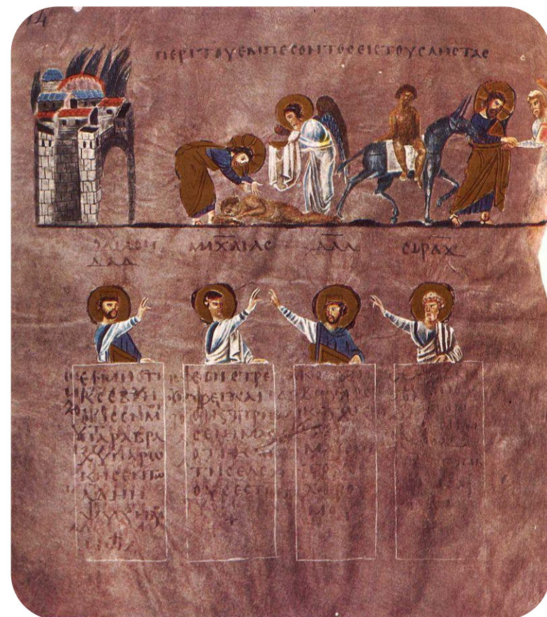
Притча о добром самарянине — миниатюра из Россанского Евангелия