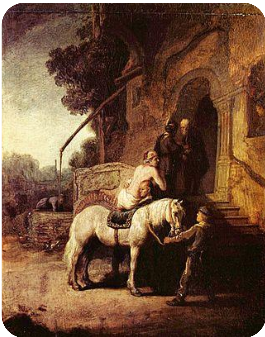
«Добрый самарянин», Рембрандт