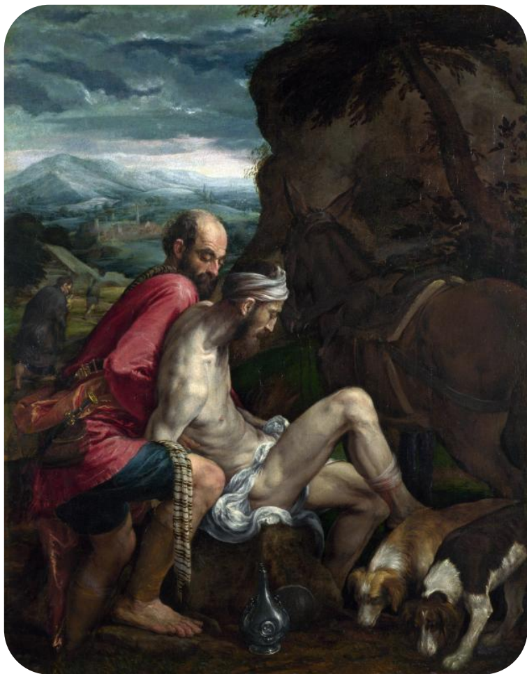
Якопо Бассано «Добрый самарянин», Лондон