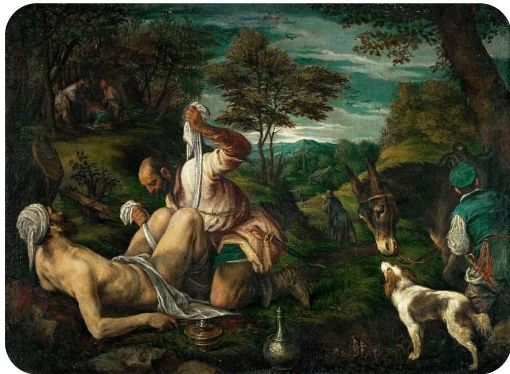
Давид Тенирс Младший «Добрый самаритянин», Метрополитен