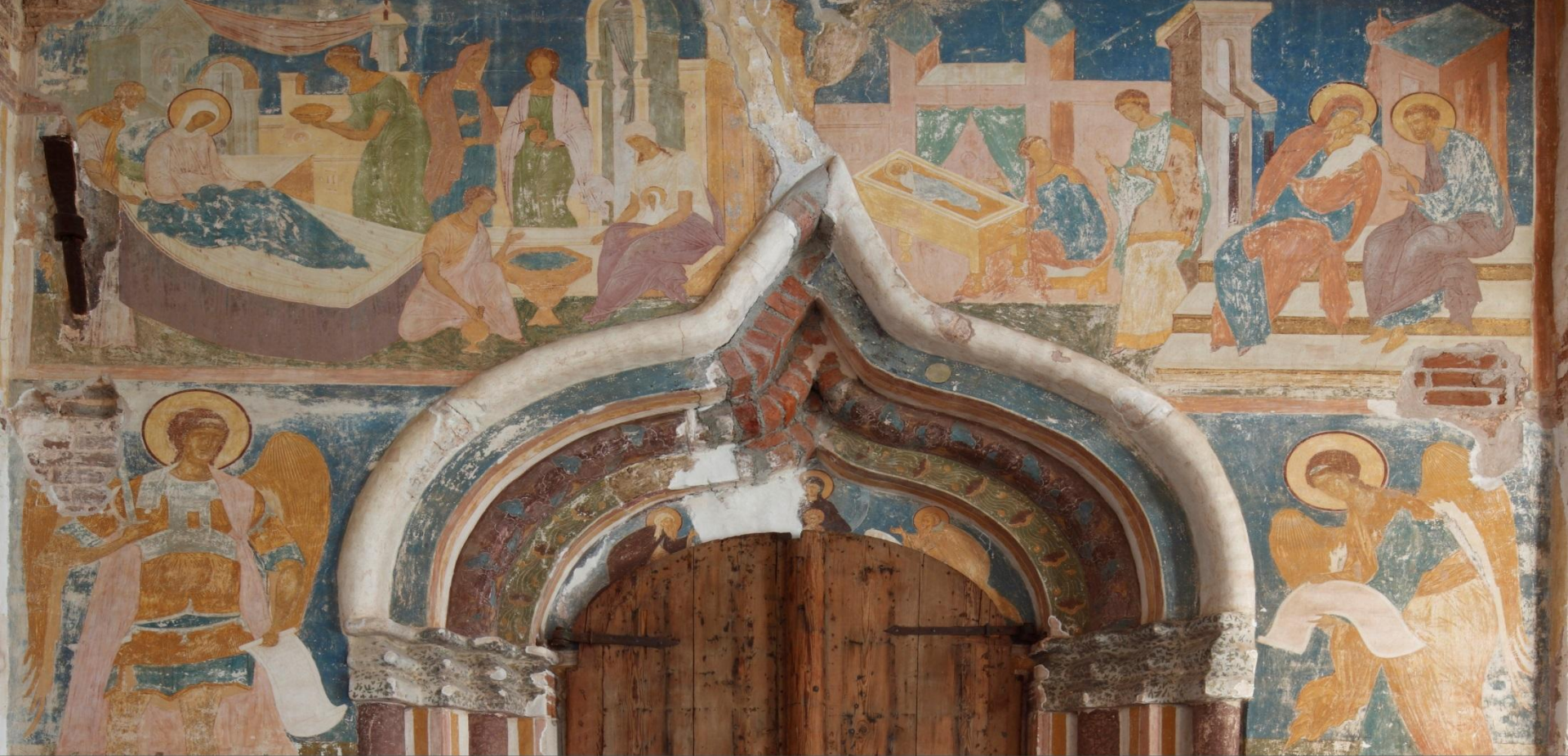
Монументальные росписи собора Рождества Богородицы, созданные Дионисием, отличаются от других стенописных памятников полной композиционной сохранностью.