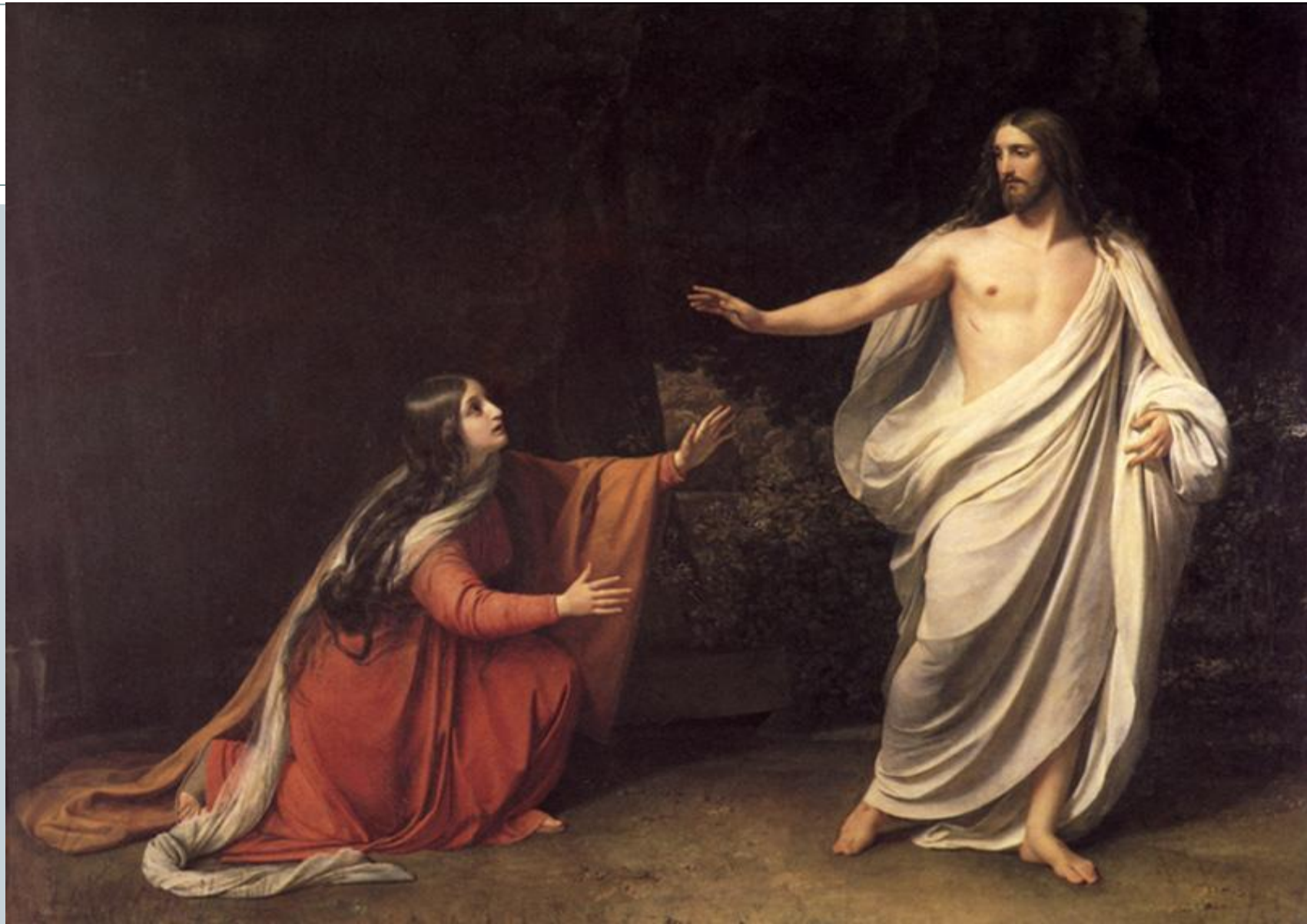
Иванов А.А. «Явление Христа Марии Магдалине после воскресения»