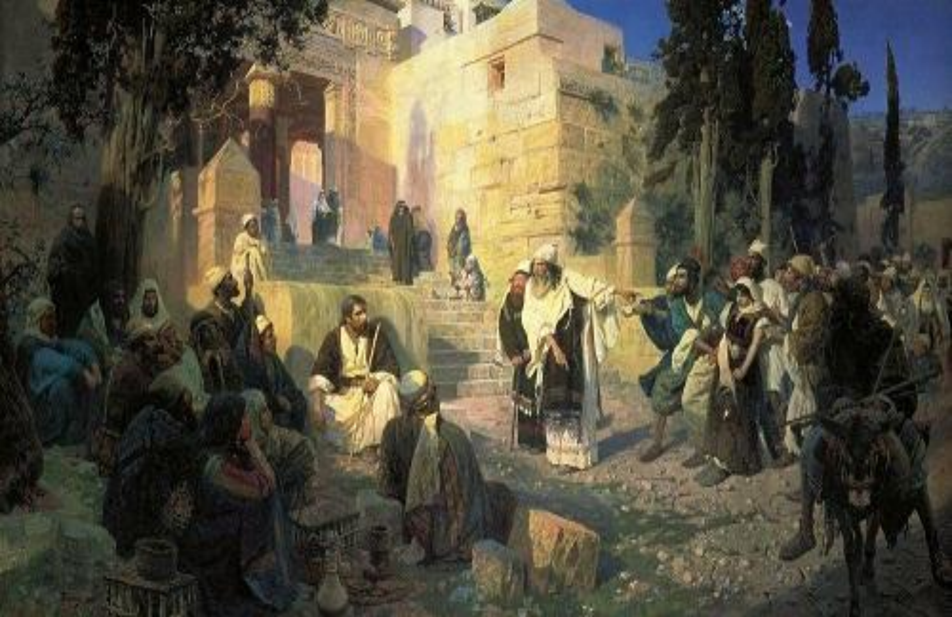
Василий Поленов «Христос и грешница»