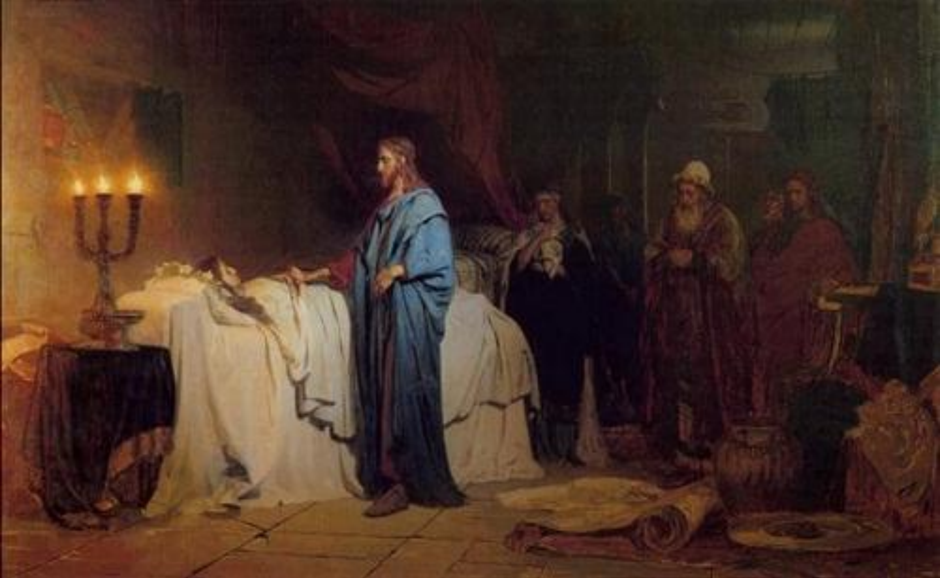
Илья Репин «Воскресение дочери Иаира»