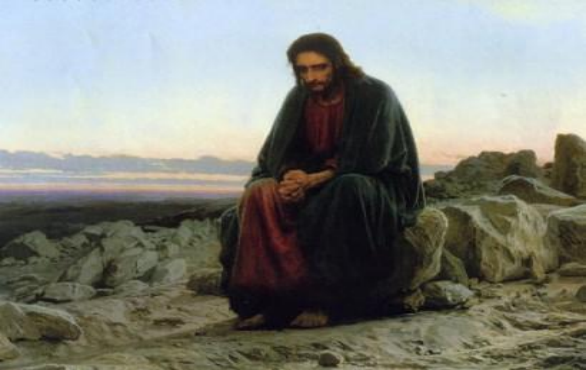
Иван Крамской «Христос в пустыне»