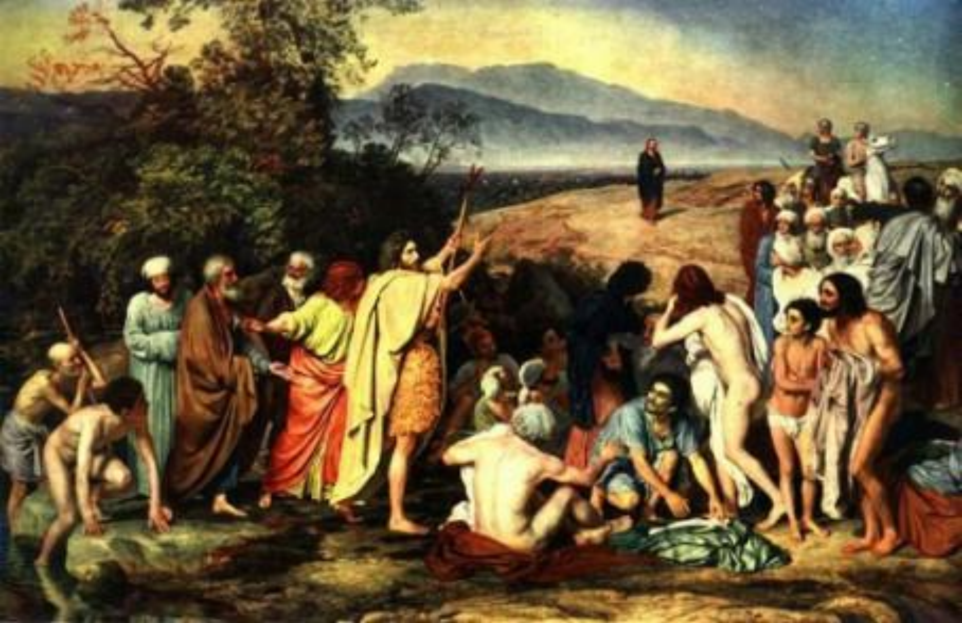
А.А. Иванов. «Явление Христа народу»