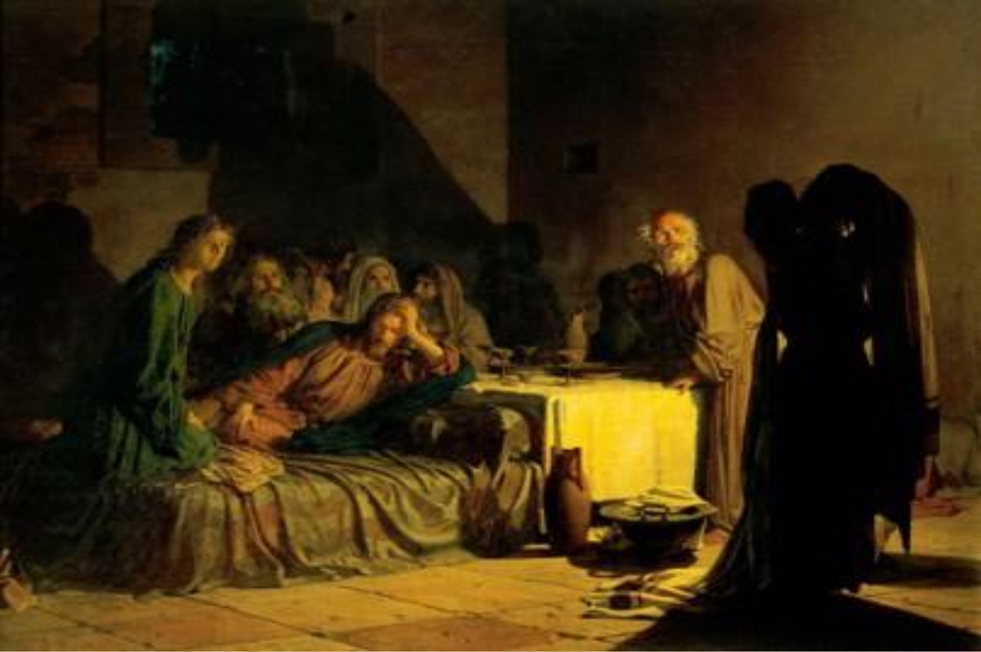
Н. И. Ге. «Тайная вечеря». 1863.