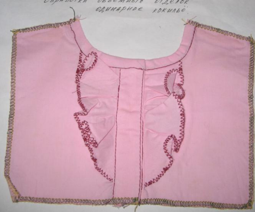
ОБРАБОТКА СВОБОДНОГО ОТДЕЛА ОДИНАРНОЕ КОКИЛЬЕ