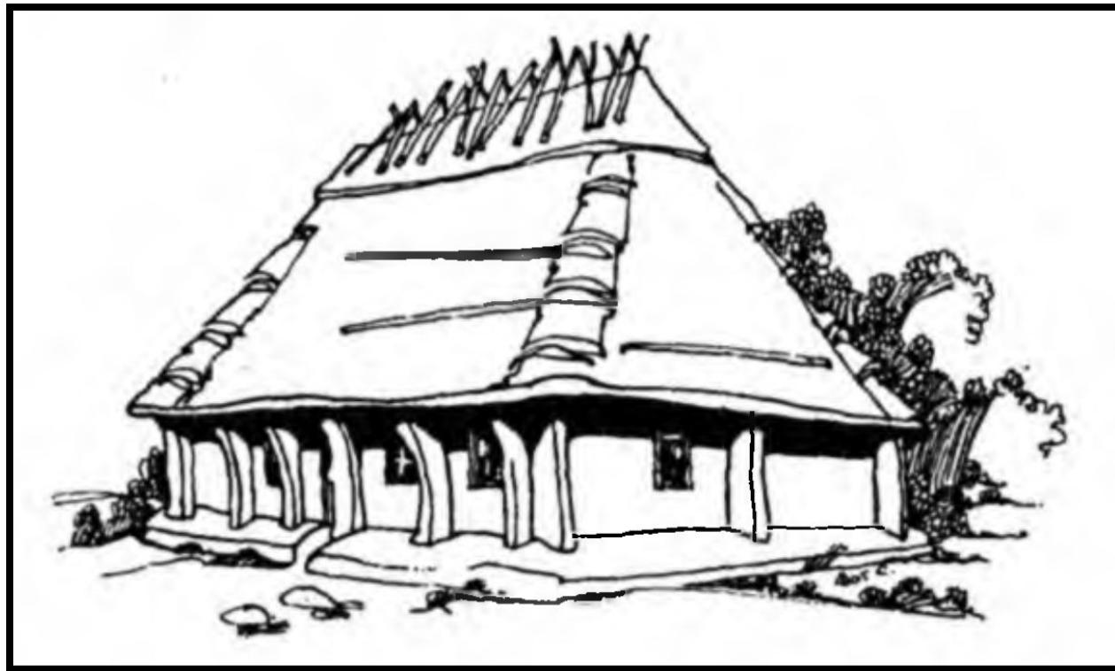
Хата. С. Васлововці Заставнівського р-ну, Чернівецької обл. (кінець XIX ст.)

Від нього відрізняються хати північної частини і Карпатських гір. Там вони дерев'яні , мають відкриті стіни.