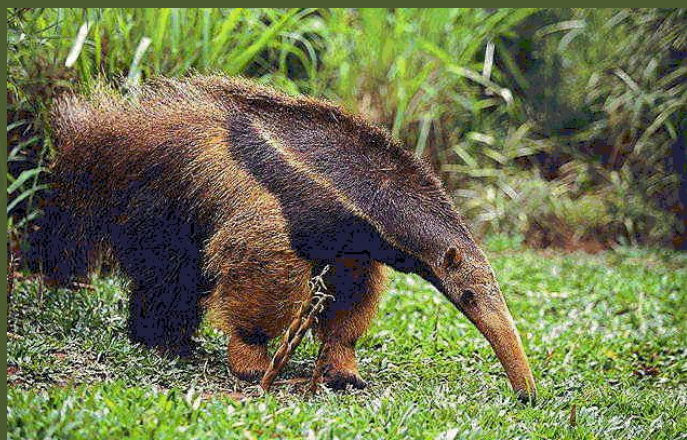
Гигантский муравьед – млекопитающее из семейства неполнозубых