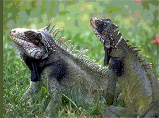
Обыкновенная игуана – самая крупная ящерица Юж. Америки