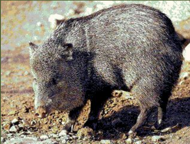
Пекари – аборигены Нового света