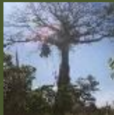
сейба Шоколадное дерево