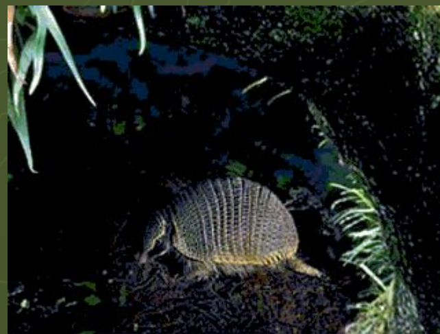
Броненосец – эндемик Нового Света