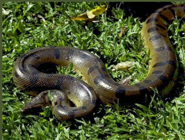
Анаконда или водяной удав