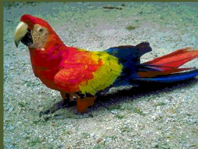
Красный ара – самый крупный из попугаев