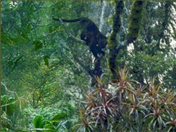
Ревуны – цепкохвостые обезьяны, внесены в Красную книгу Международного союза охраны природы