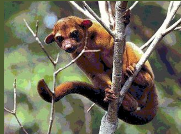
Кинкажу – единственный представитель семейства енотовых, ведущий исключительно древесный образ жизни