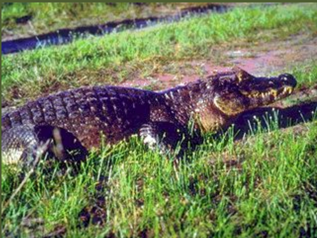
Широкомордый кайман достигает в длину 3.5м, от крокодилов отличается строением челюстей