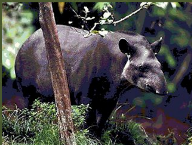
Равнинный тапир – непарнокопытное животное