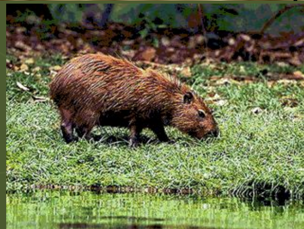
Капибара – самый крупный современный грызун (длина тела до 1.3 м)