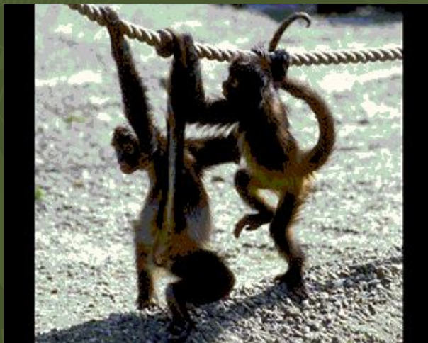
Коаты – цепкохвостые обезьяны