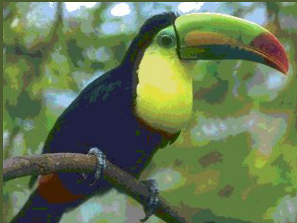
Туканы примечательны своими огромными клювами, размеры которых сравнимы с размерами их тела