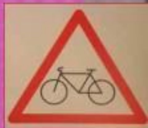
Знак, предупреждающий о наличии велосипедной дорожки