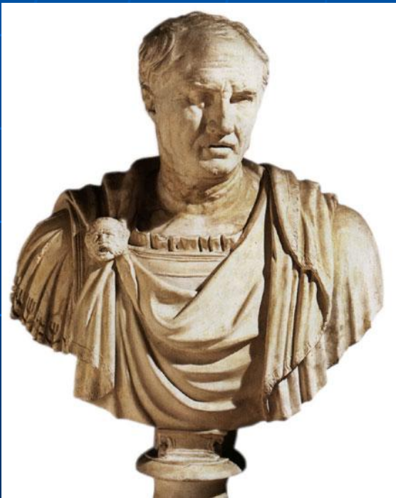
римский оратор Цицерон