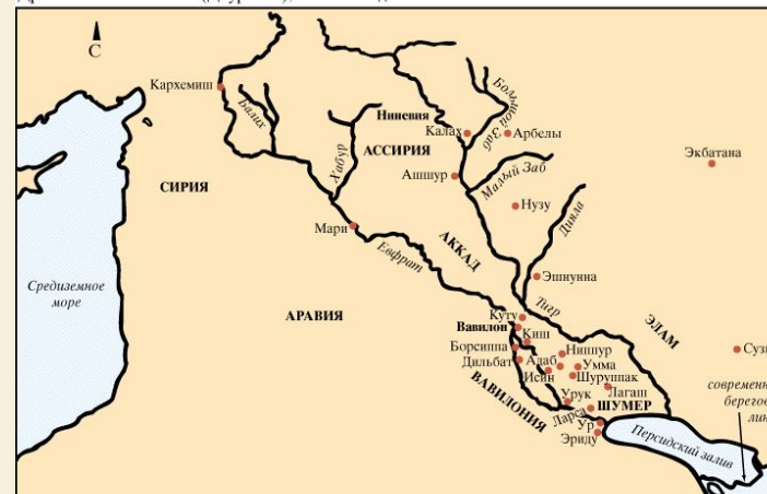
Древняя Месопотамия (Двуречье), 3100-1600 до н.э.

Последние три стадии А. Тойнби называет понятием «упадок цивилизации».