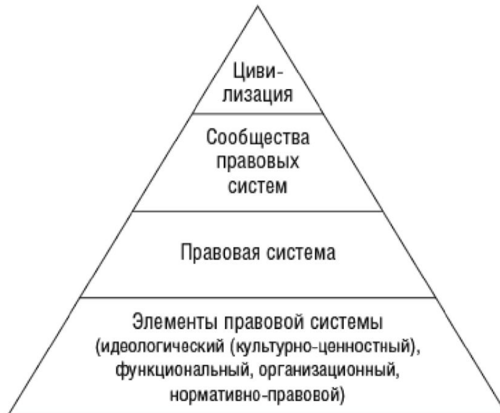
Рис. 1. Пирамида объектов сравнительного правоведения