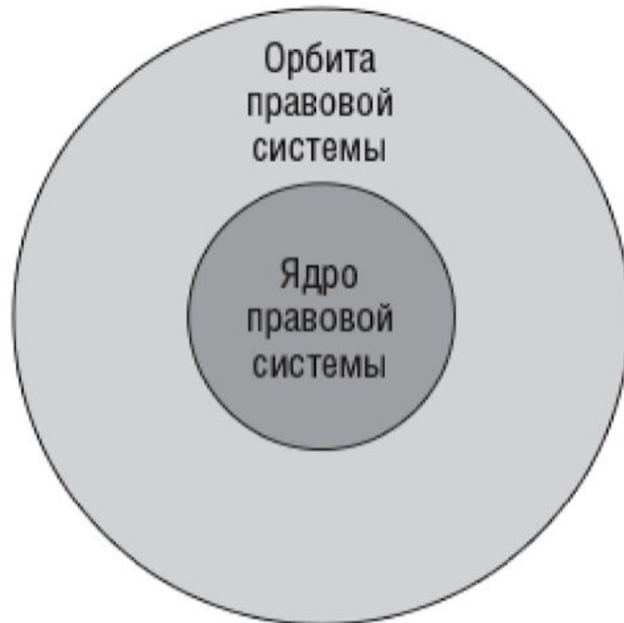
Рис. 3. Схема строения правовой системы