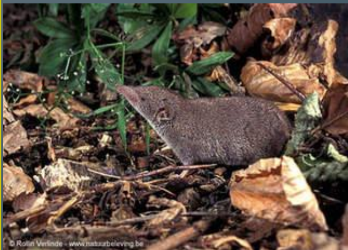
Малая бурозубка Пашенная