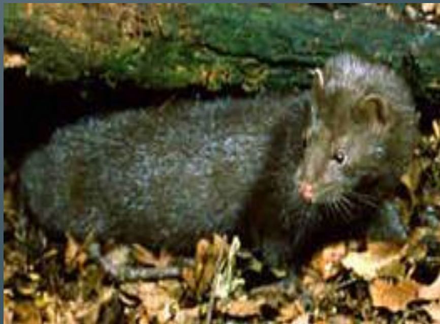
Европейская норка норка