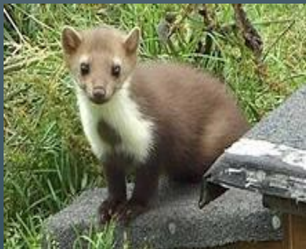
Каменная куница полчек