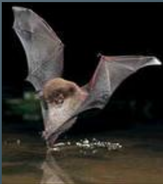
Водяная ночница кожанка