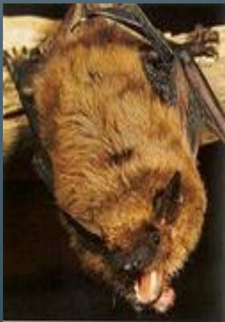
Двухцветная кожанка Степной хорь