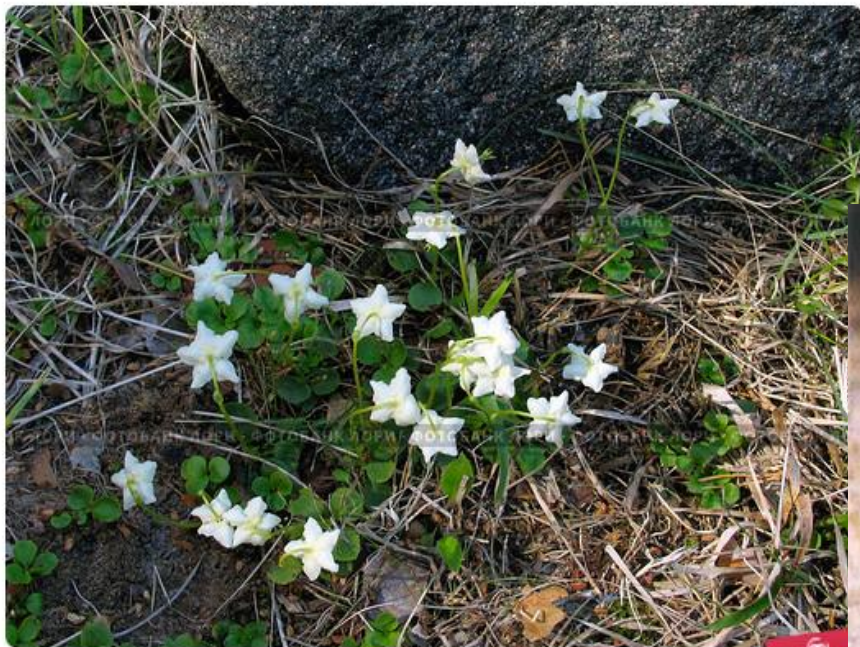
Одноцветка крупноцветковая ( Moneses uniflora ) семейства Грушанковые