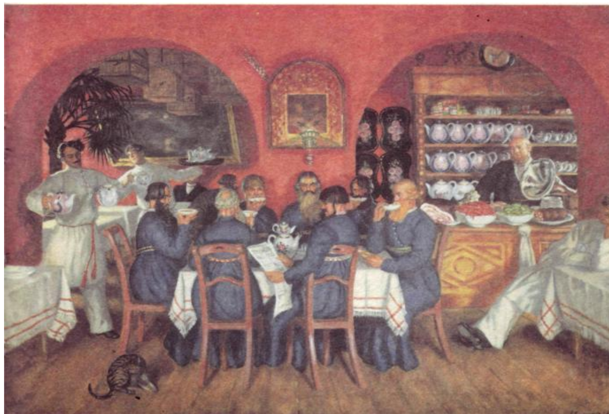
Б. Кустодиев. Московский трактир