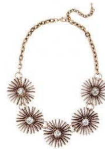
FLOWER NECKLACE BAUBLE BAR