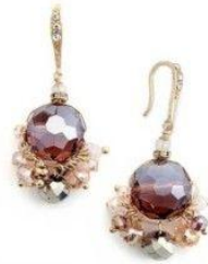
BEAD DROP EARRINGS MACY'S