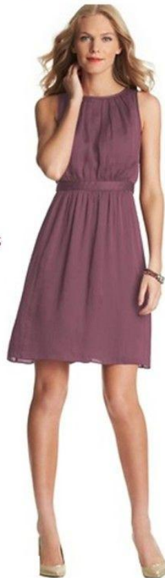
PLEATED DRESS BY LOFT