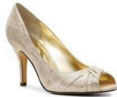
FULTAN PUMP NINA