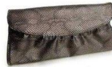
BRONZE CLUTCH MILANOO