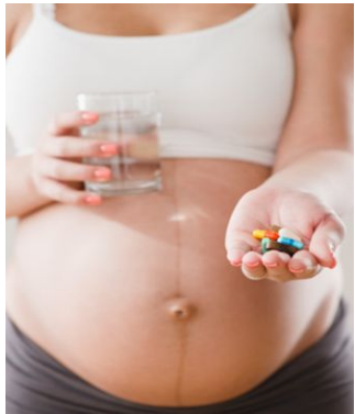
Рис.6 Беременная женщина

При назначении препаратов обязательно учитывается срок беременности. Крайне нежелательно применять антибиотики в первом триместре, когда происходит формирование жизненно важных органов плода. В этом случае антибактериальные препараты способны повреждать функции и органы ребенка, вызывая врожденные патологии. Если лечение матери все же необходимо, наши врачи обеспечивают строжайший контроль над процессом терапии, чтобы при возникновении даже малейших осложнений отменить препарат.