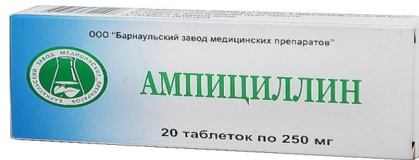
Рис.5 Полусинтетические антибиотики