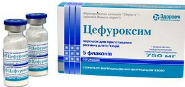
Рис.2 Бактерицидные антибиотики