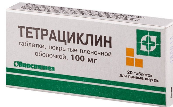
Рис. 3 Бактериостатические антибиотики