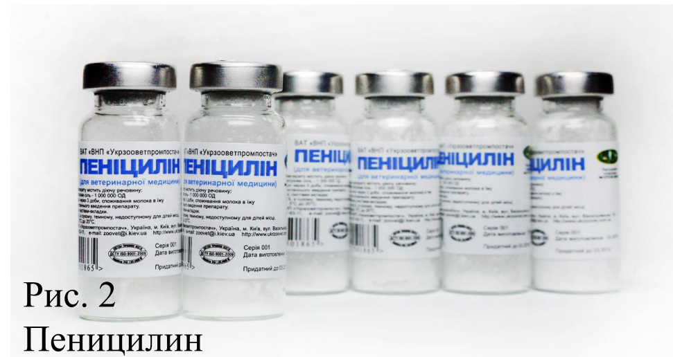
Рис. 2 Пенициллин

Менее чем за 100 лет создано более сотни различных антибактериальных препаратов. Некоторые из них уже устарели и не используются в лечении, а некоторые только вводятся в клиническую практику.