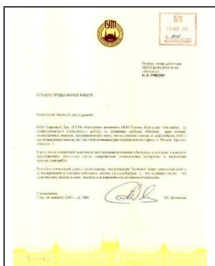
Торговый дом ГУМ