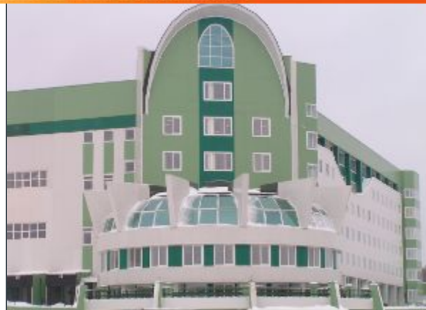
Распреде- лительные центры, складские комплексы