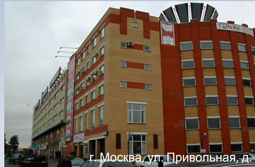
г. Москва, ул. Привольная, д.