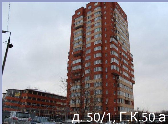
д. 50/1, Г.К.50 а