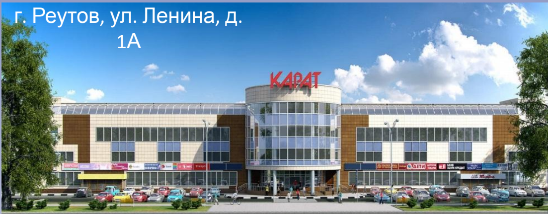
г. Реутов, ул. Ленина, д. 1А