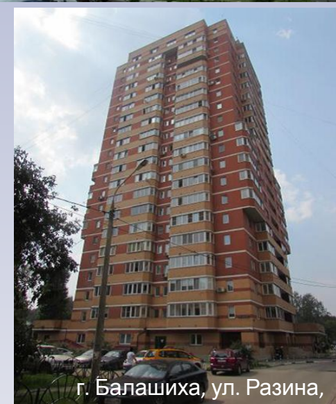
г. Балашиха, ул. Разина,