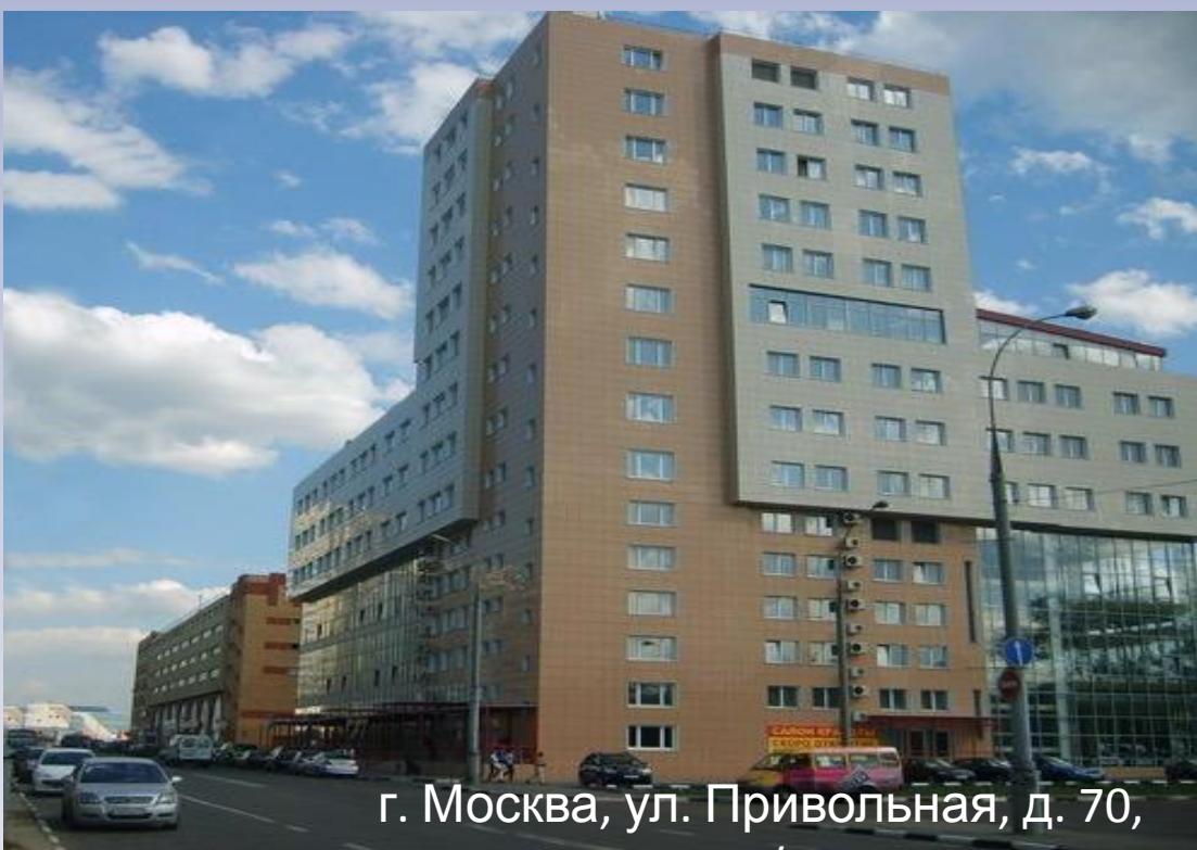
г. Москва, ул. Привольная, д. 70,