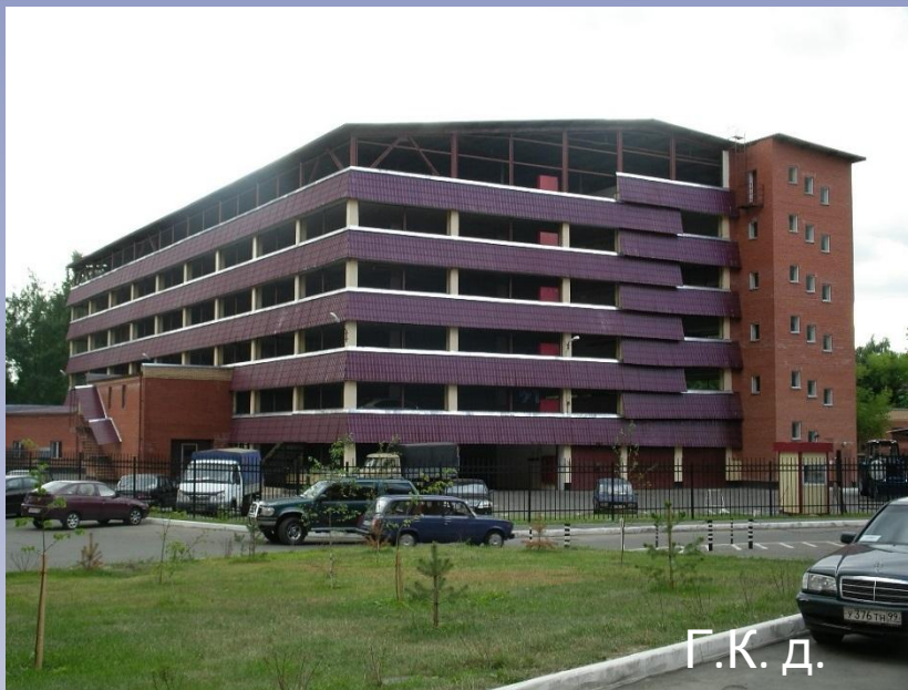
Г.К. д. 47/1а