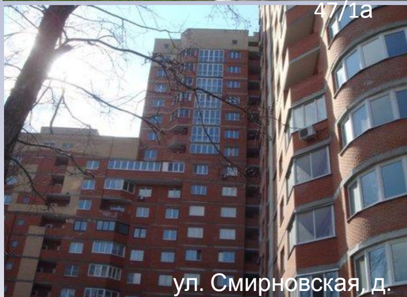
ул. Смирновская, д.