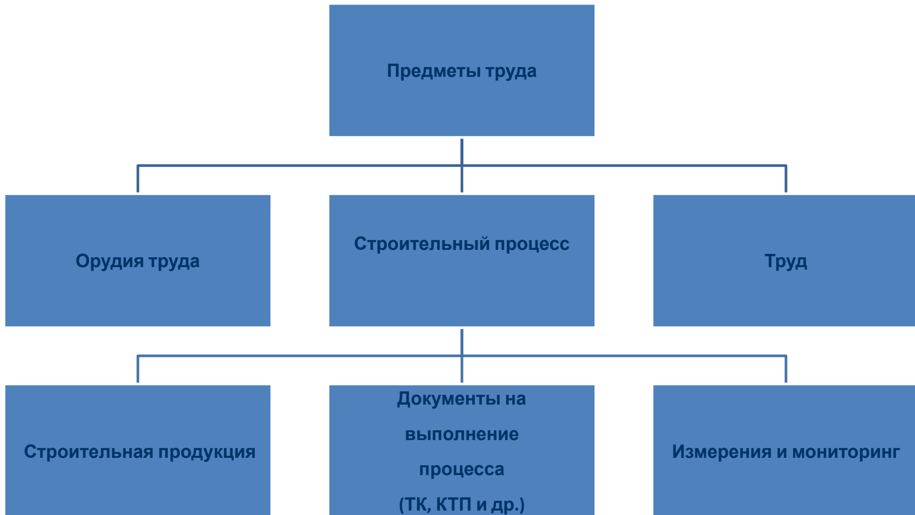
СХЕМА ПОЛУЧЕНИЯ СТРОИТЕЛЬНОЙ ПРОДУКЦИИ