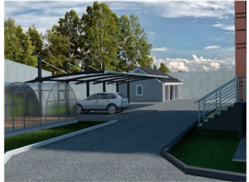
Визуализация территории детского дома «Непоседы» Вид на парковку