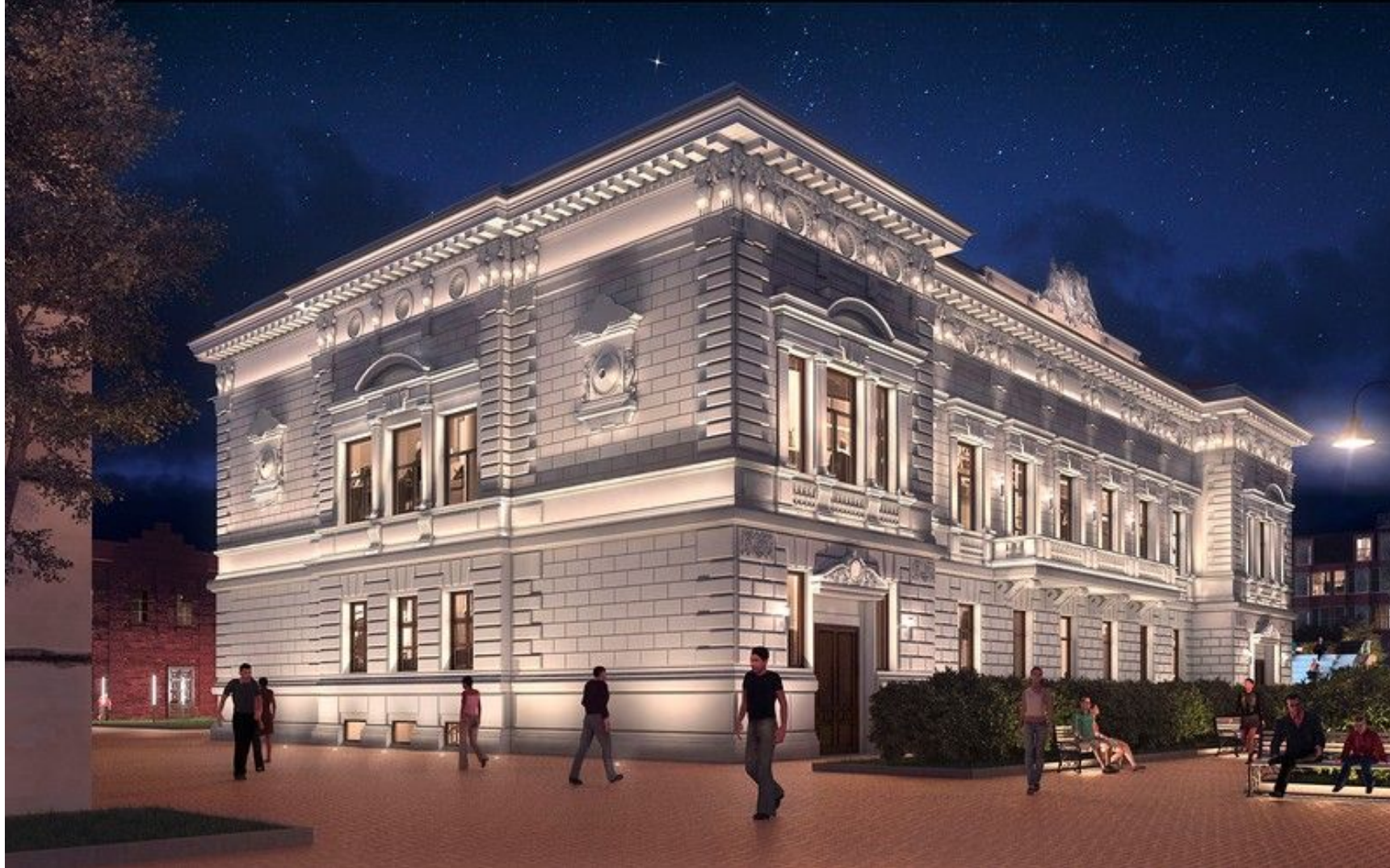
Концепция реставрации и приспособления особняка Субботина-Шихобалова