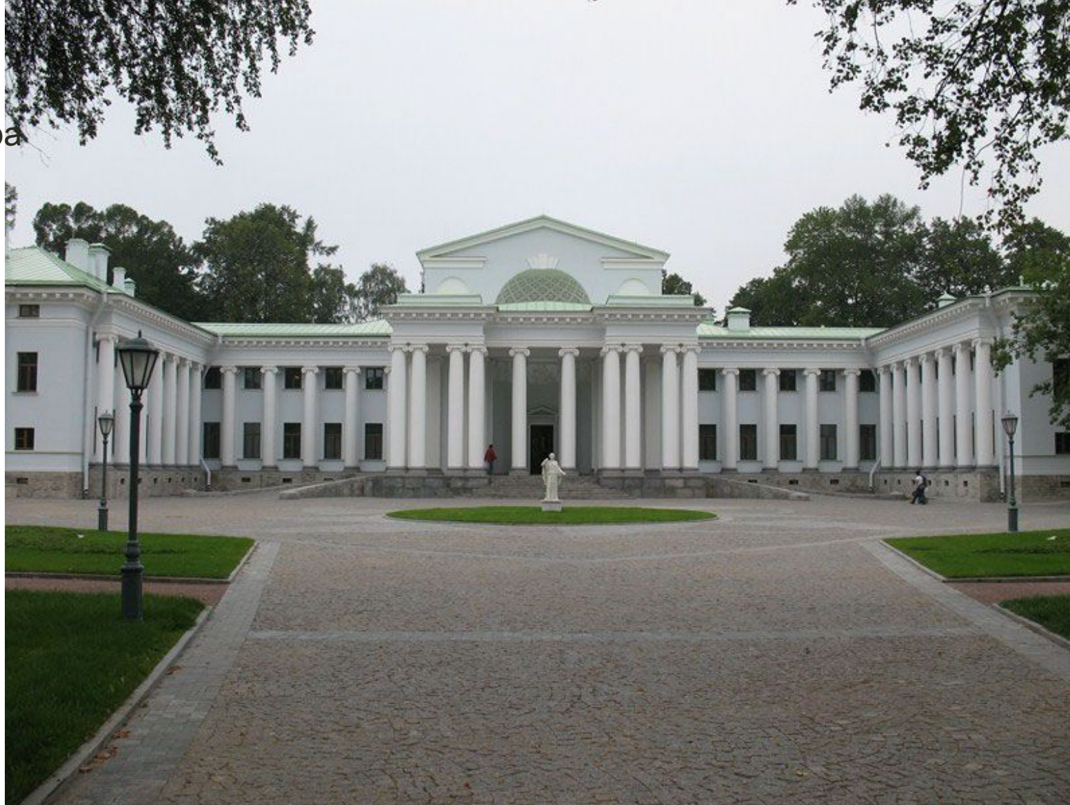
Рис. 12 Главный фасад

Этот особняк в стиле "классицизм" появился здесь еще в начале XVIII века, Особняку относительно повезло. После революции он сменил не так уж много хозяев, а потому сохранился в относительно хорошем состоянии. В 1930-е годы сюда переехал Союз архитекторов, который владеет зданием до сих пор.