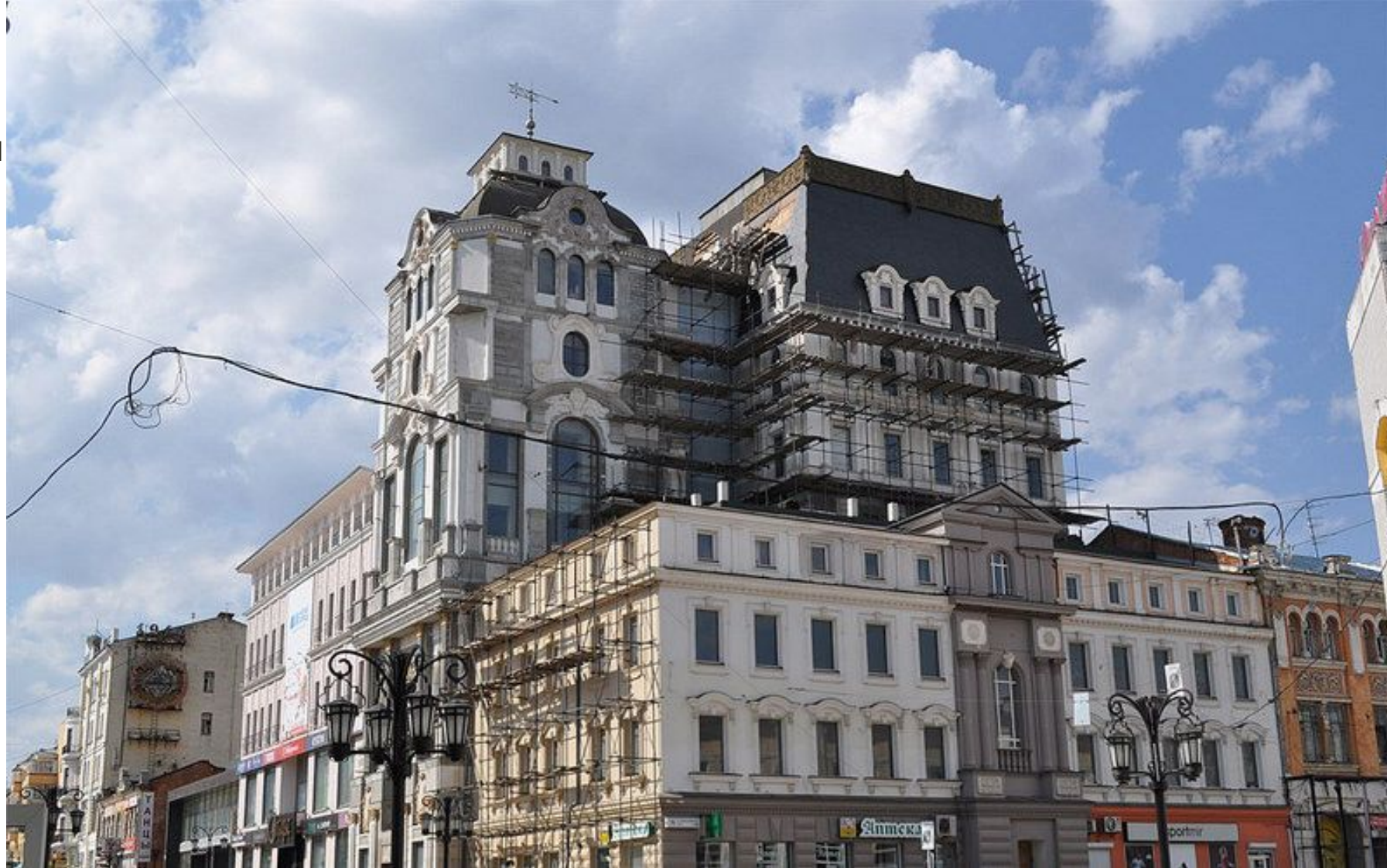
Рис. 18 Строительные работы

Архитекторы: Рокко Маньоле, Лоренцо Кармеллини, Александро Мендини. Начало строительства — 1997 год.