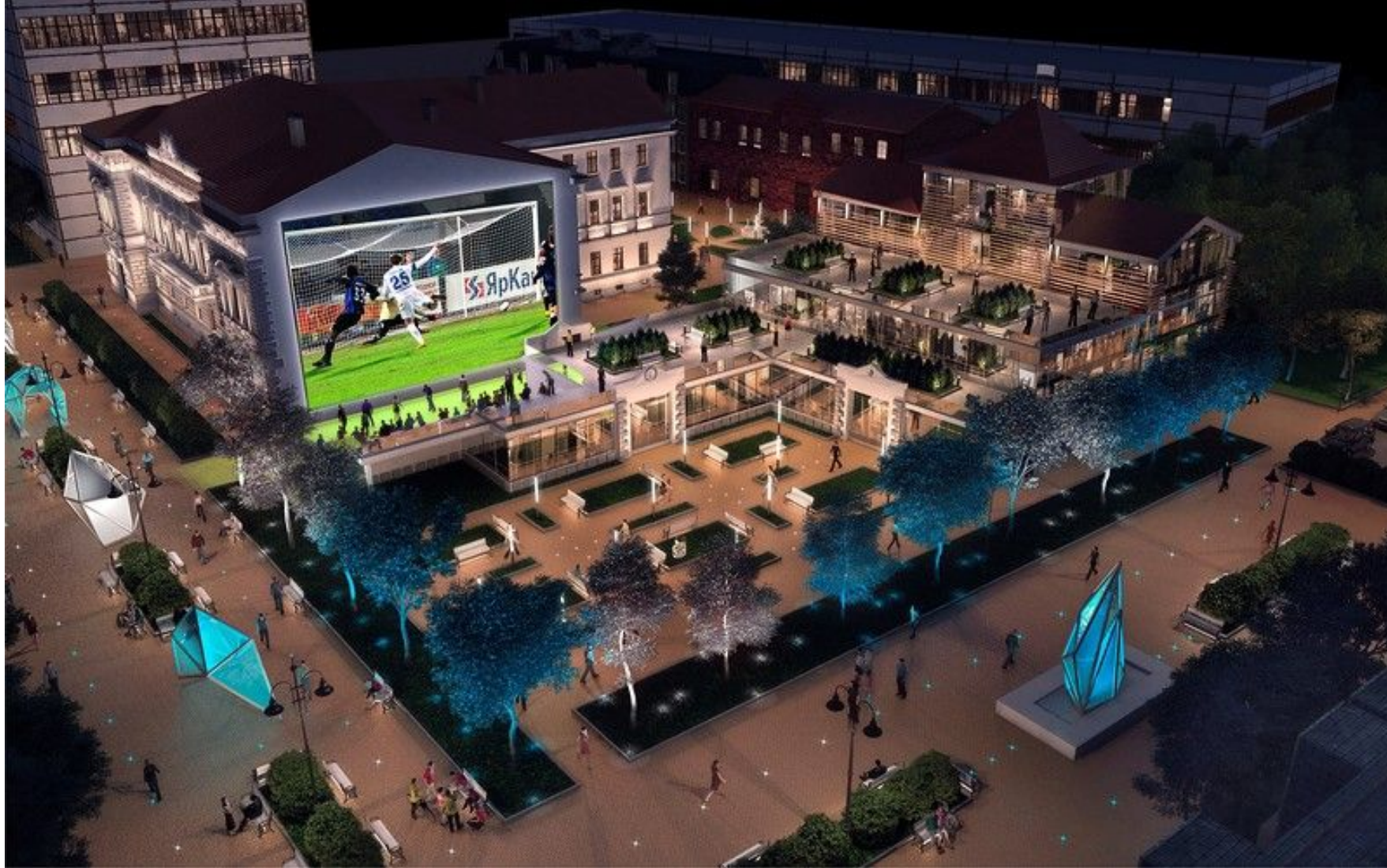
Рис. 24 Проект

К Чемпионату мира по футболу-2018 планируют реставрацию особняка Субботина-Шихобалова и приспособление его для современного использования.