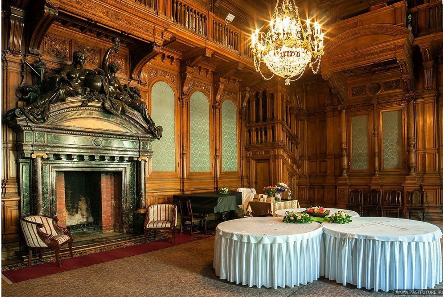
Рис. 17 Библиотека