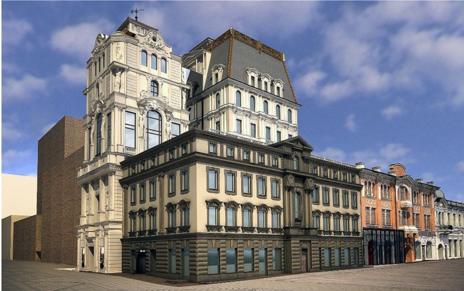
Рис. 19 Проект галереи «Атриум»

Здание объединяет три исторических особняка, которые теперь представляют собой сложное сплетение архитектурных стилей и исторических эпох.