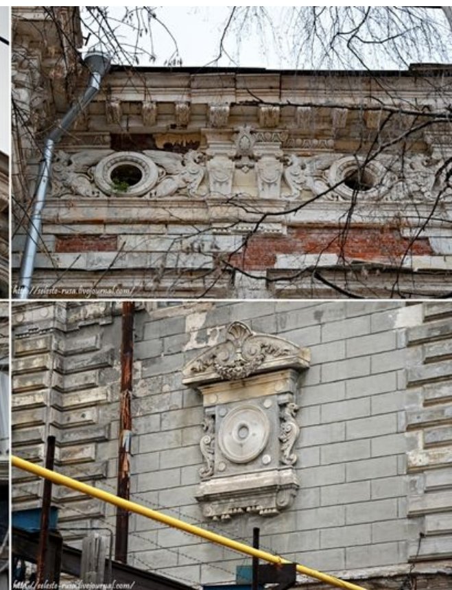
Рис. 21-22 элементы фасада осоньяка Субботина-Шихобалова