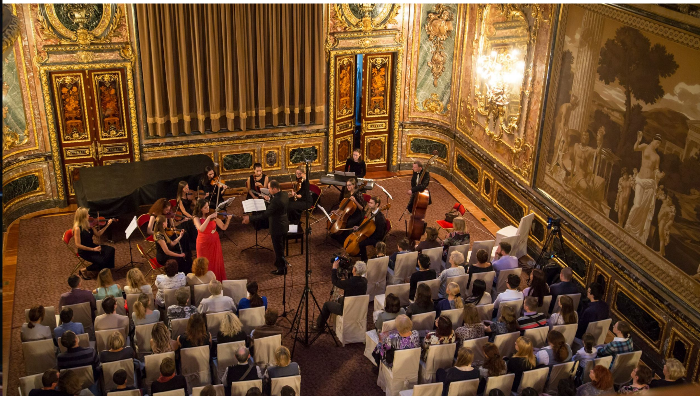
Рис. 15-16 Бронзовый зал

Бронзовый зал – в этом зале проводятся конференции, концерты