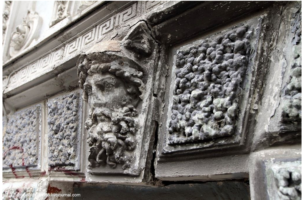
Рис. 3 Лепнина над оконным проемом

Сысоев был весьма неплохим формовщиком и лепщиком. Он перестроил дом при помощи архитектора Зубова, превратив его фасад в своеобразную витрину своего производства.