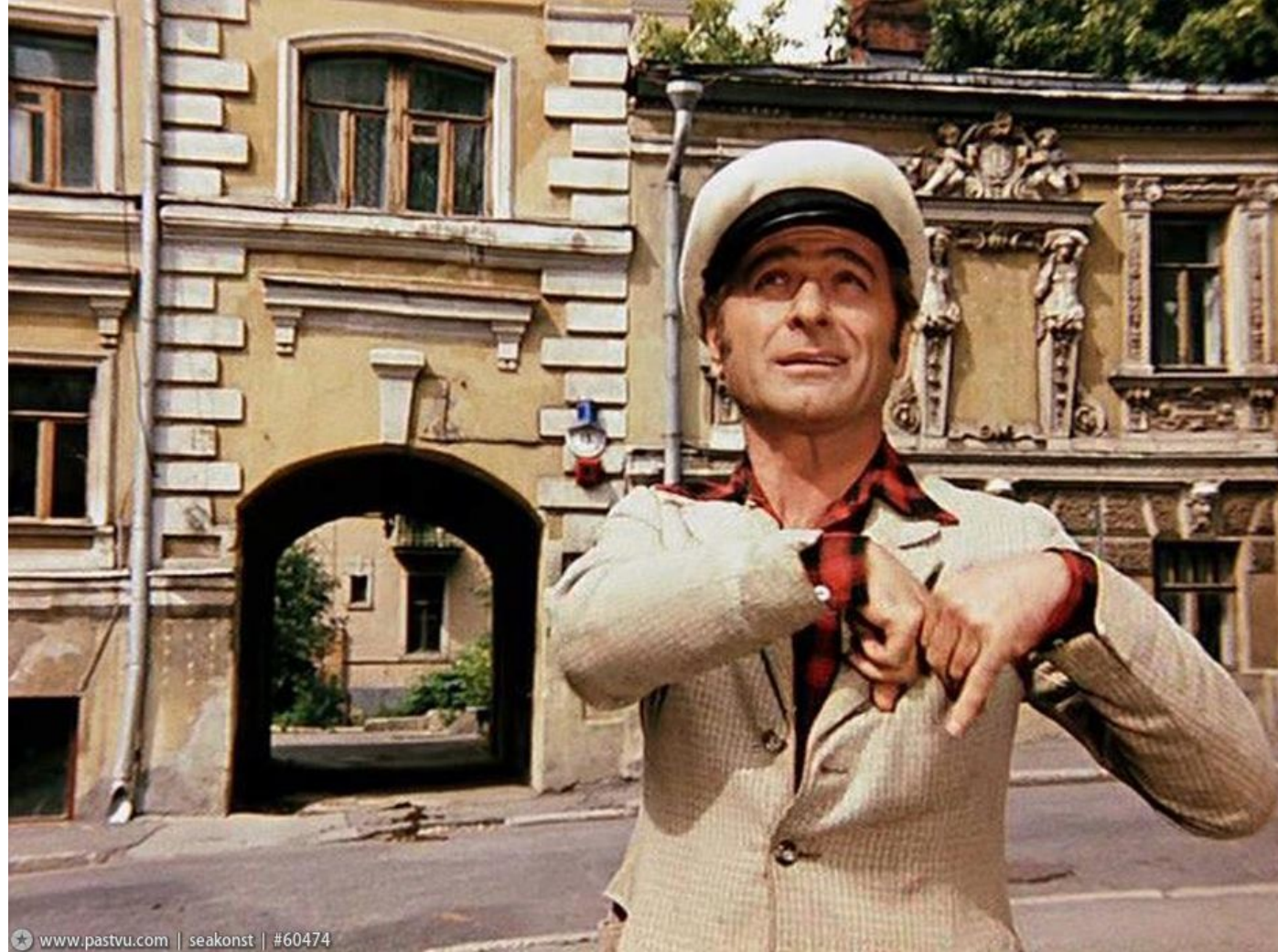
Рис. 4 Кадр из фильма «12 стульев»

Этот особняк попал и в кино. Там жила Эллочка-людоедка из первой версии "12 стульев".