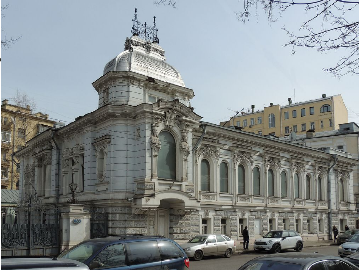
Рис. 10 До реставрации

Особняк Коробковой был заложен в 1866 году. Он был полностью перестроен Кекушевым 1894 году. В 1930-х годах в особняке на Пятницкой жили несколько президентов Академии наук СССР, в послевоенные годы в здании уже расположился Институт истории искусств АН СССР.