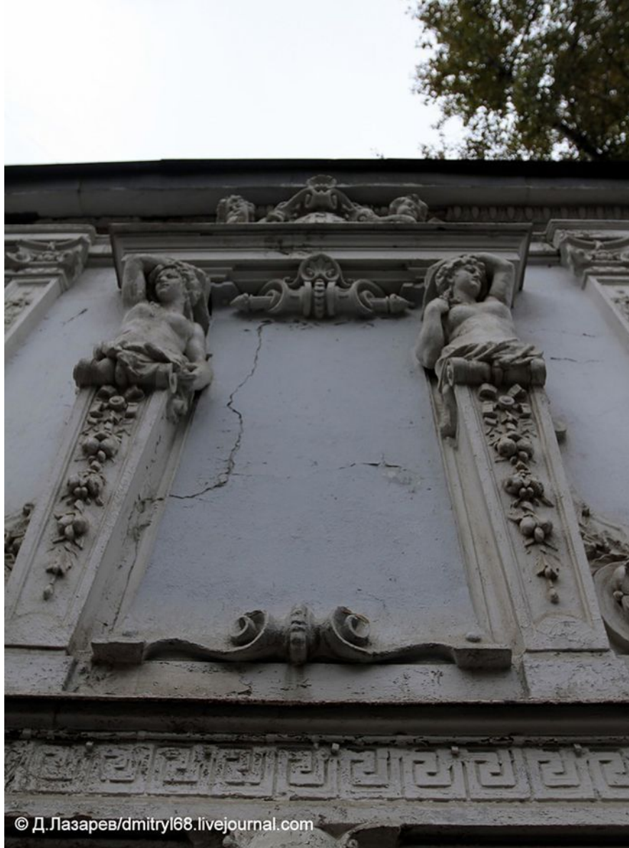
Рис. 2 Кариатиды