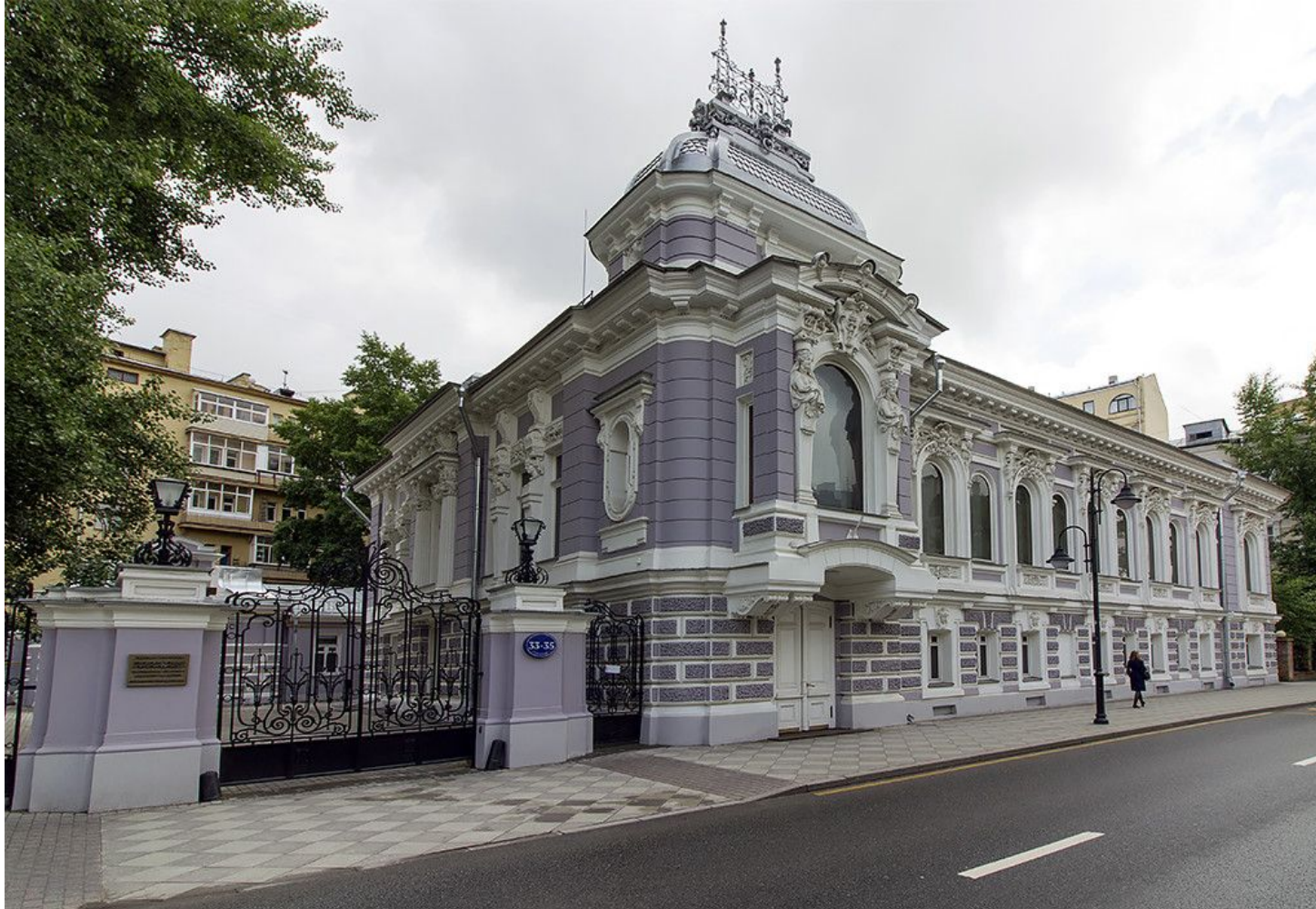
Рис. 11 После реставрации

Уникальное здание-образец классического московского модерна теперь обладает сиренево-лиловым цветом.