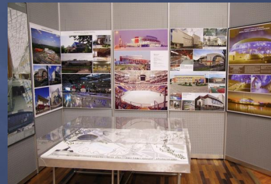
Фото залов Информационного центра до реконструкции