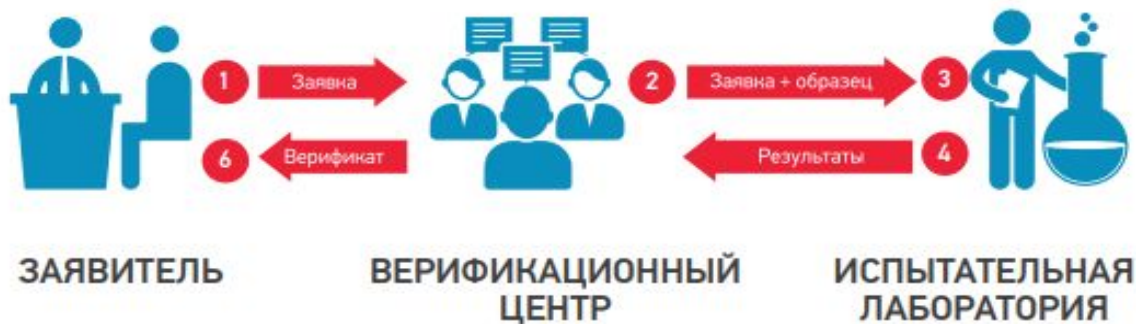
Схема прохождения процедуры верификации