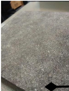
Гранит RAL 7039