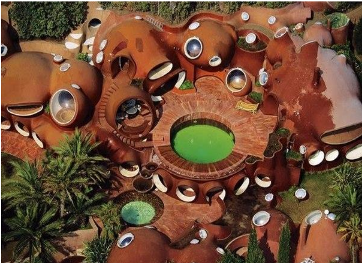
Дворец пузырей. Канны. Начало 70-х годов 20-го века. Арх. Антони Гауди