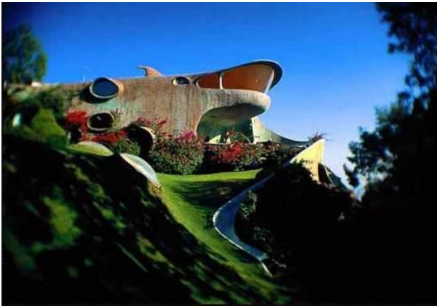
Дом Акула. Мексика. Арх. Хавьера Сеносиана, 1990 г.