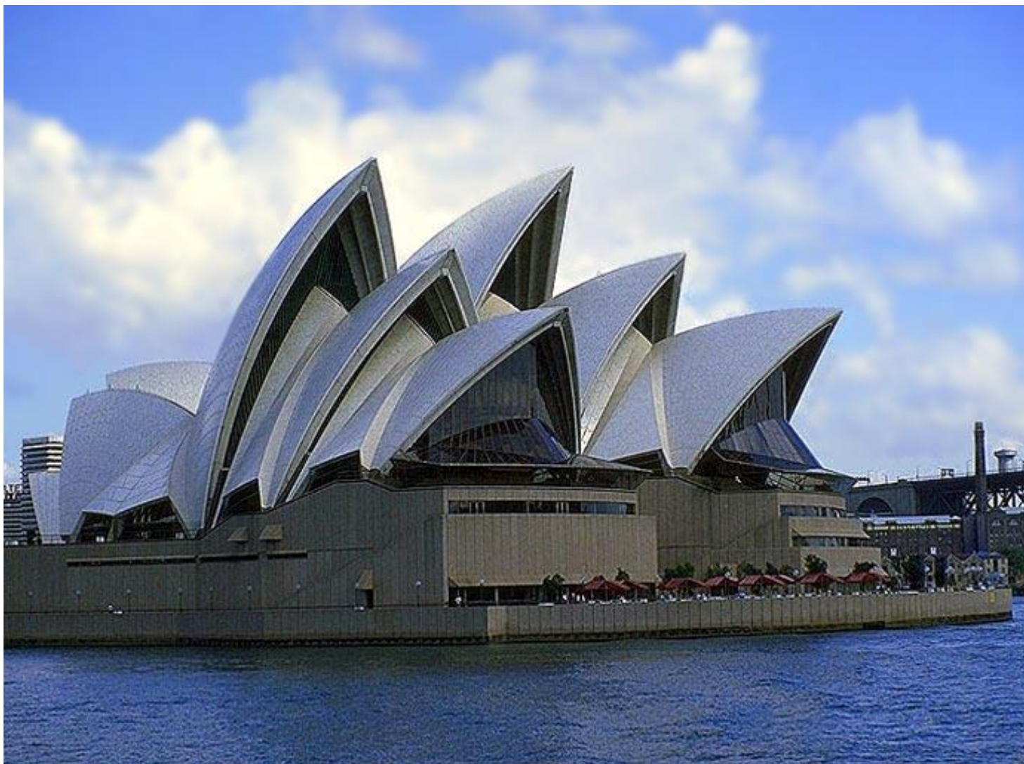
Оперный театр. 1959-1973 г. Австралия, Сидней. АрхИорн Устцон