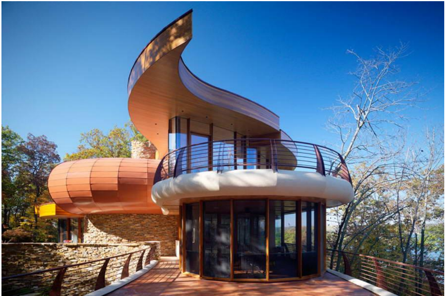
Резиденция Ченеква (Chenequa Residence). 2011 г. Висконсин, США. Арх. Роберт Харви Ошатс