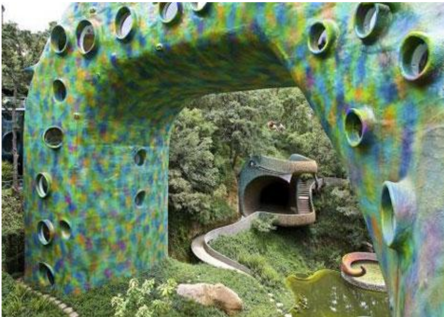
Гнездо Кецалькоатля, Наукальпан, Мексика, 2007г. Арх. Хавьер Сеносиан