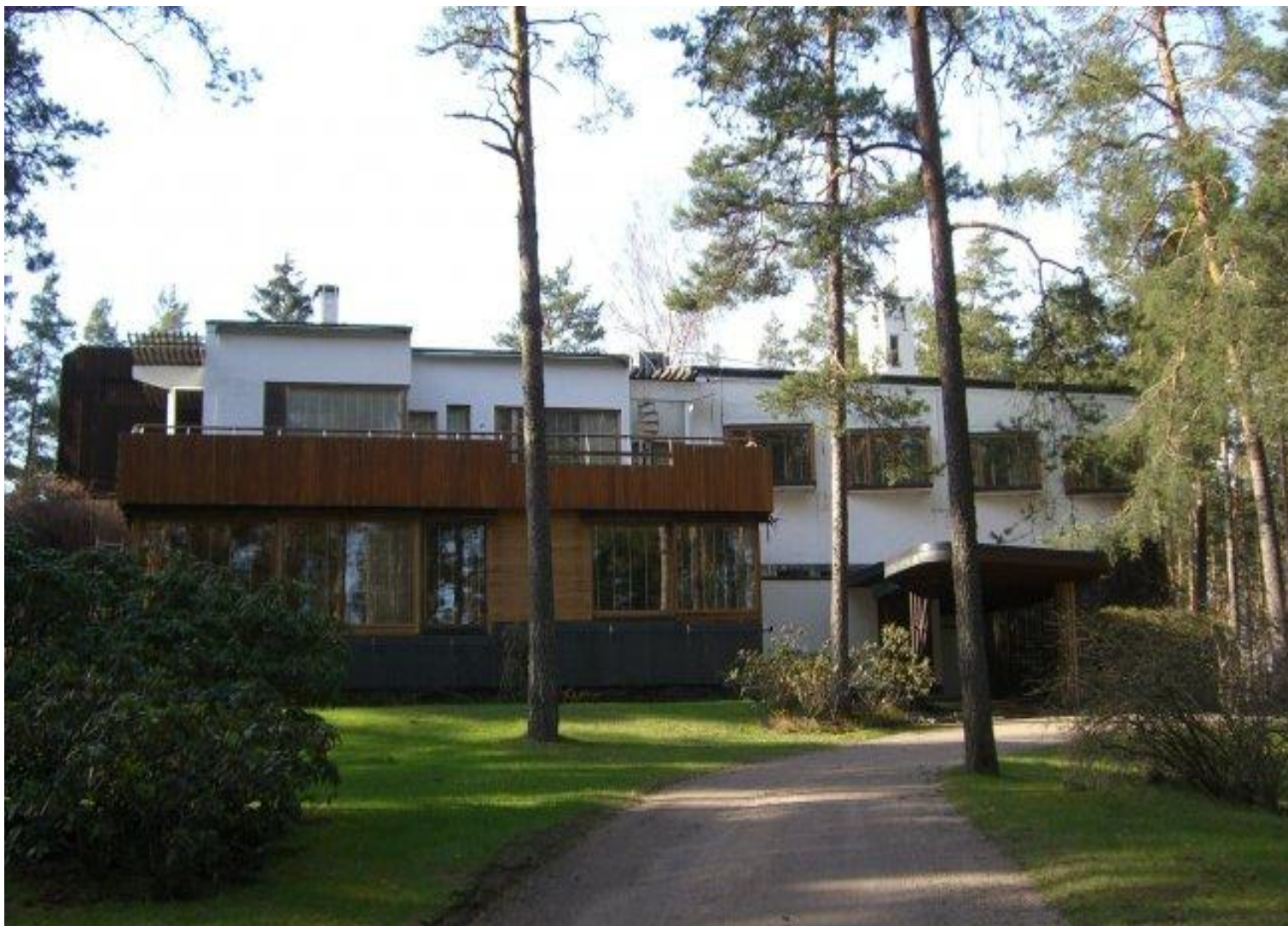
Загородная вилла Mairea. Нормарку, 1938-1939. Арх. Хуго Алвар Хенрик Аалто