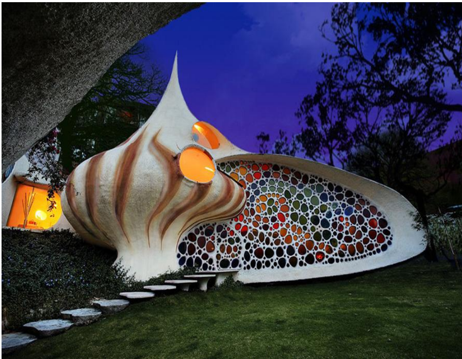
Дом «Наутилус». 2006 г. Мексика. Наукальпан-де-Хуарес. Хавьер Сенсиана. Арх.