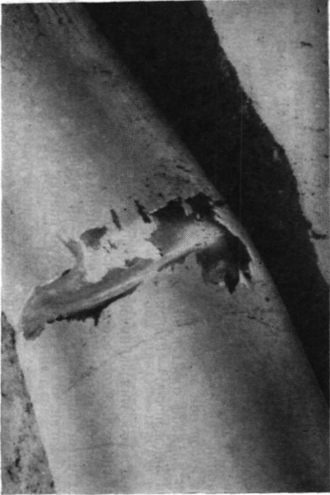
Рис. 6.5. Излом трубы при укладке

Повреждение трубопровода происходят из-за: