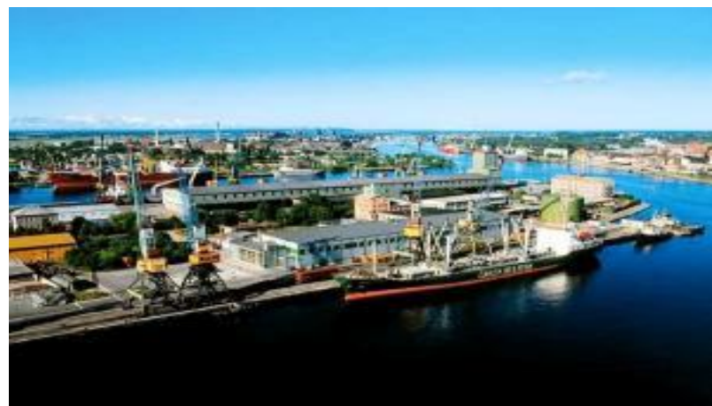
Калининградский морской рыбный порт