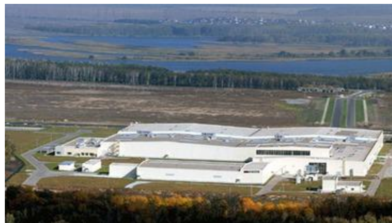
Завод «YOKONAMA», Липецк