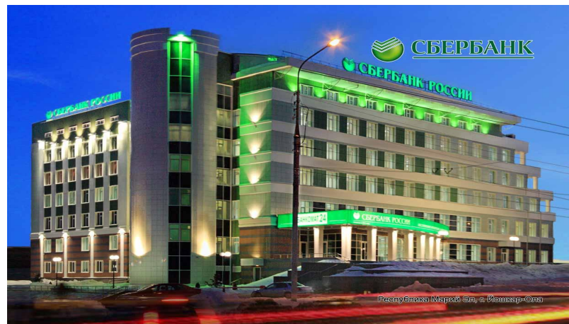
Сбербанк России (несколько отделений)