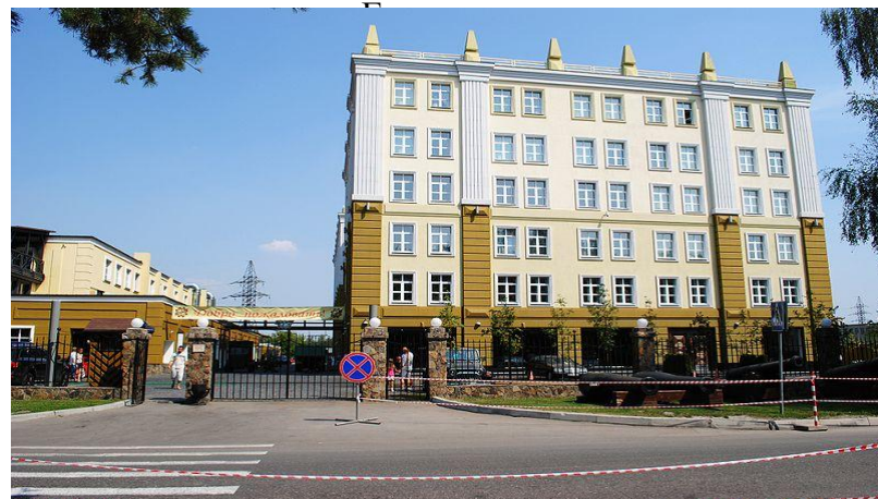
Музей техники Вадима Задорожного