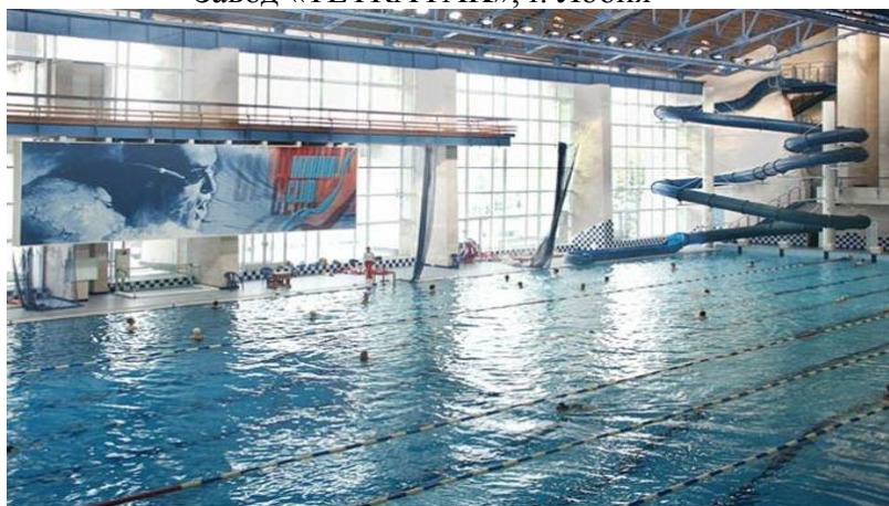
Бассейн «ЦСК ВМФ»