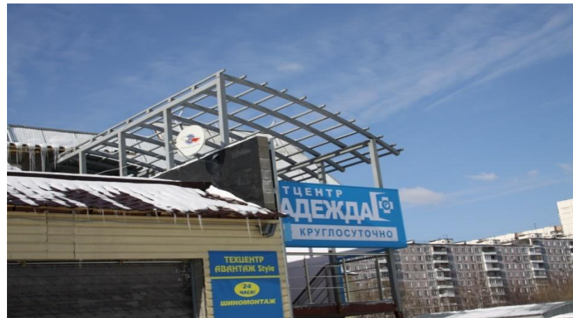
ТЦ, ул.Вильнюсская 5 (изготовление металлоконструкции)