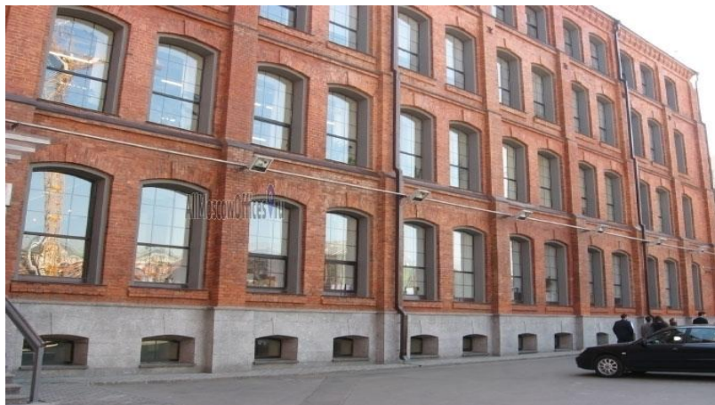
«Красная Роза 1875», ул. Тимура Фрунзе к.44/45