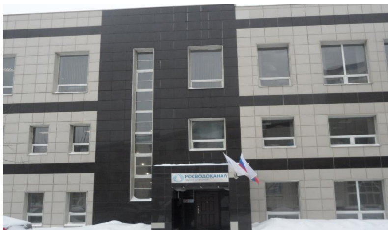
«Росводоканал», Гамсоновский переулок 2