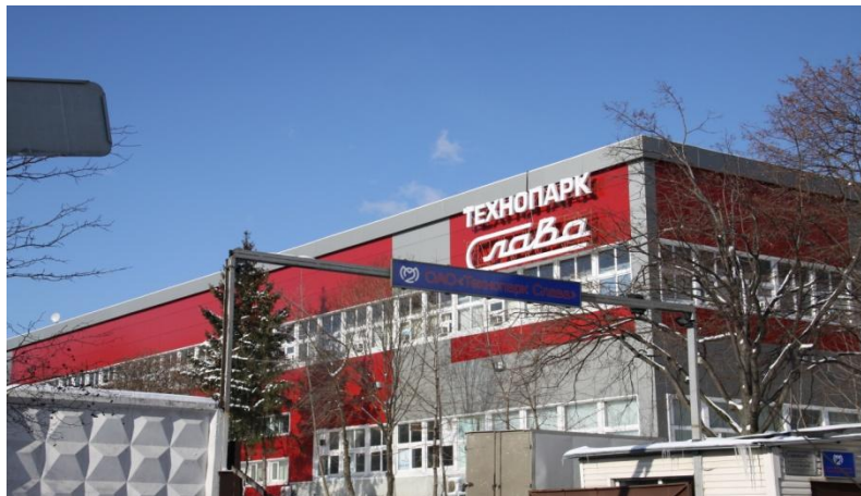
«Технопарк Слава», Научный проезд 20/2