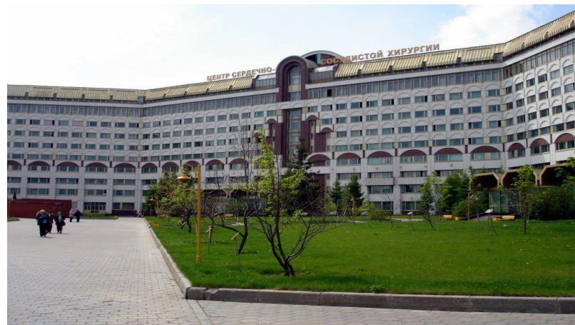
Научный центр сердечно-сосудистой хирургии им. А.Н.Бакулева