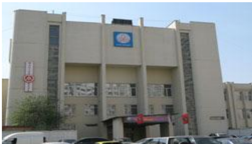
НПО «Взлет», ул. Производственная 6