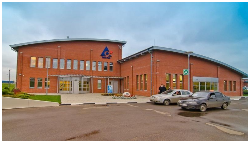
Завод «TETRA PAK», г. Лобня