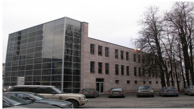
БЦ «Омега Плаза»