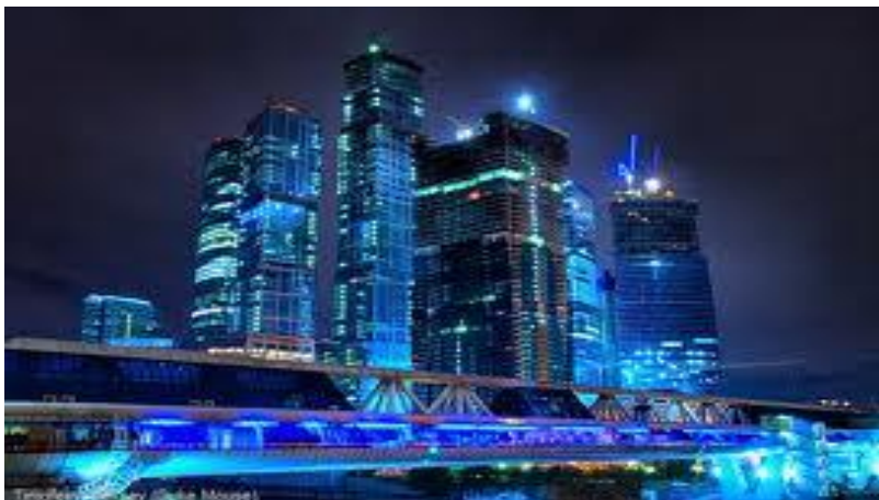
БЦ «Москва Сити»