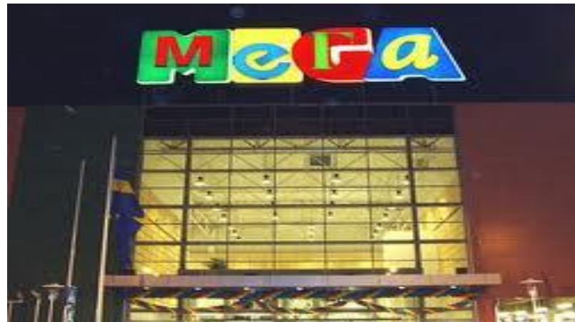
Мега, г. Краснодар