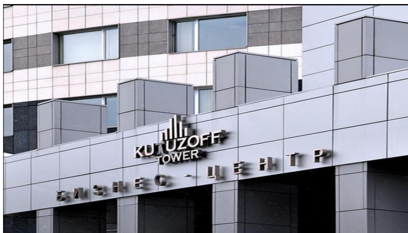
БЦ«KUTUZOFF TOWER», Ивана Франко 20