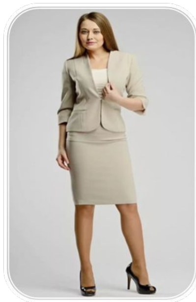
Костюм четвертого типа