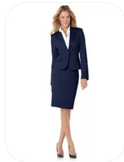
Костюм пятого типа