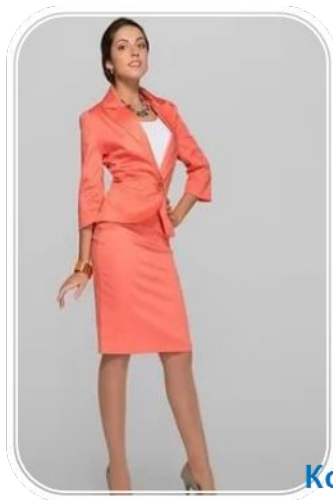
Костюм второго типа