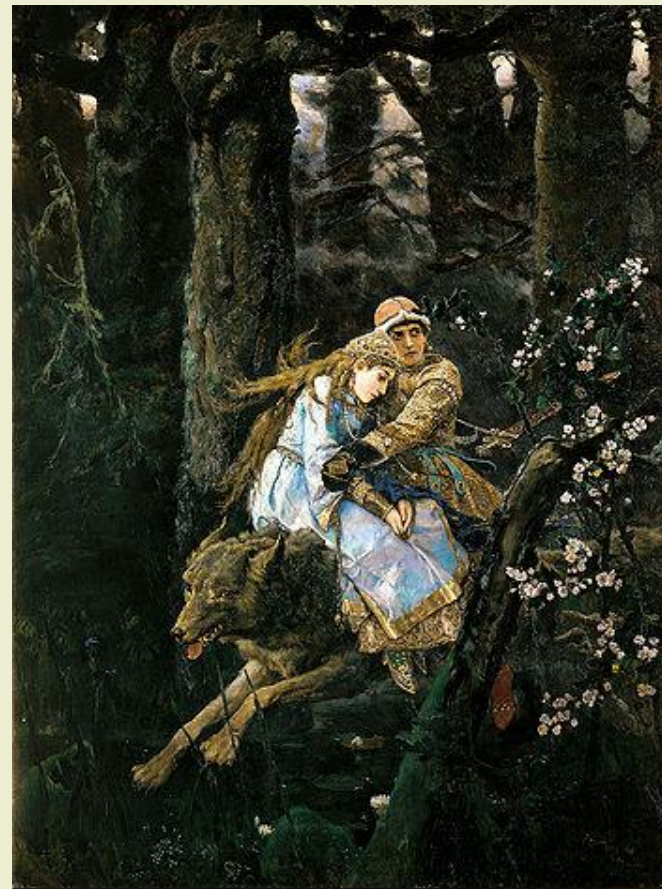
«Иван Царевич на Сером Волке» 1879