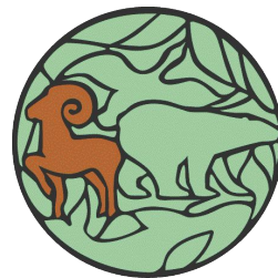
18873 кв.км Заповедник ПУТОРАНСКИЙ