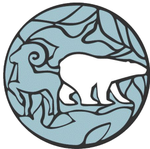
Заповедник БОЛЬШОЙ АРКТИЧЕСКИЙ