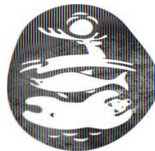
КРОНОЦК государственный при биосферный заповедн