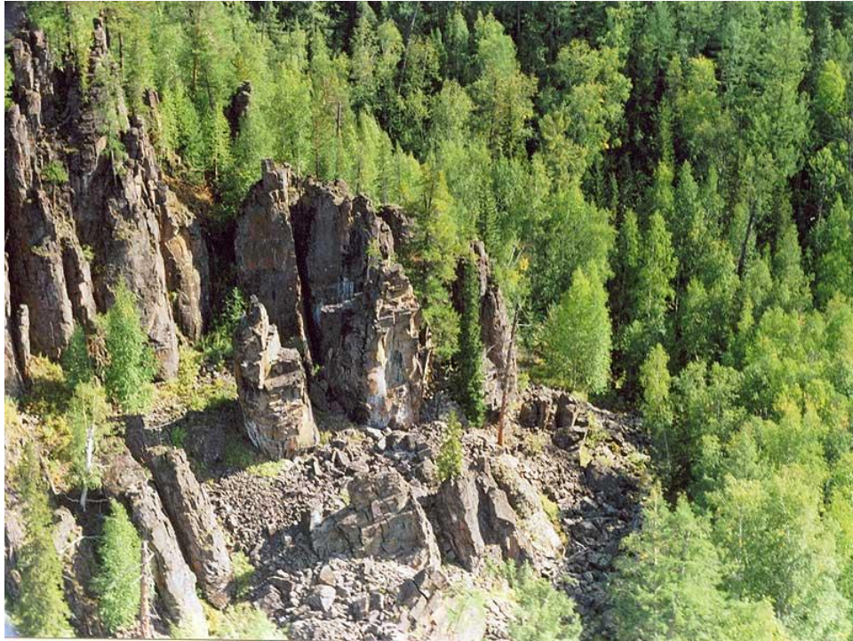
Центральносибирский биосферный заповедник

Главная задача заповедников - сохранение и восстановление эталонных природных экосистем, а также свойственного для данного региона генофонда организмов.