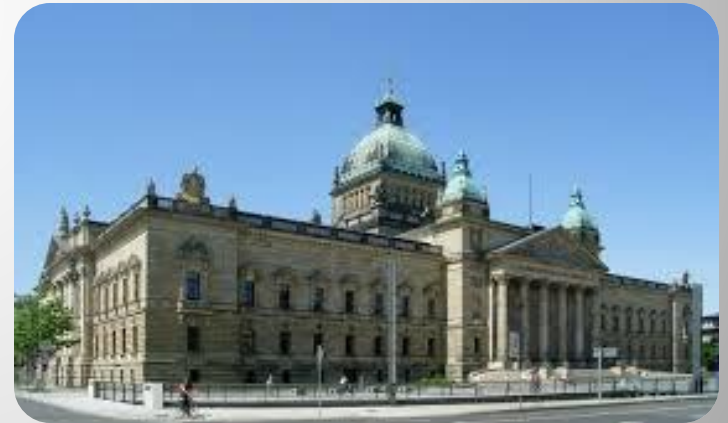
Siedziba Federalnego Sądu Administracyjnego w Lipsku