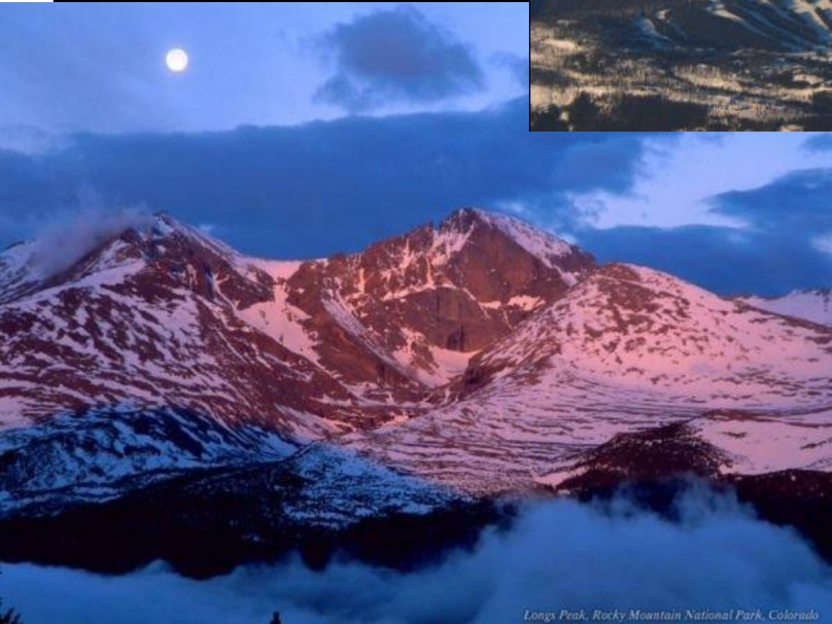
Longs Peak, Rocky Mountain National Park, Colorado