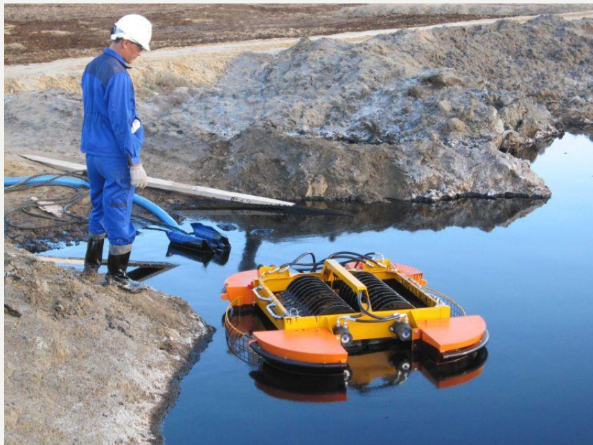
Нефтесборное устройство (скиммер) Спрут-2

Катер-нефтесборщик со встроенной системой сбора аварийных разливов нефти LORS по каждому из бортов