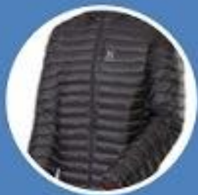
пуховый свитер до 500г