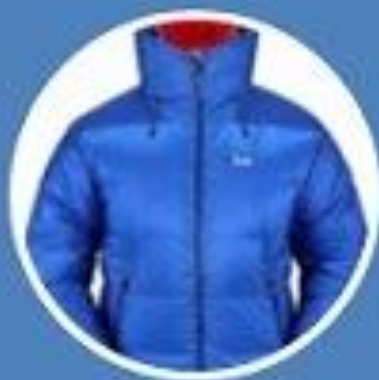
универсальная пуховка до 1000г