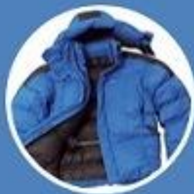
экспедиционная пуховая куртка до 1500г