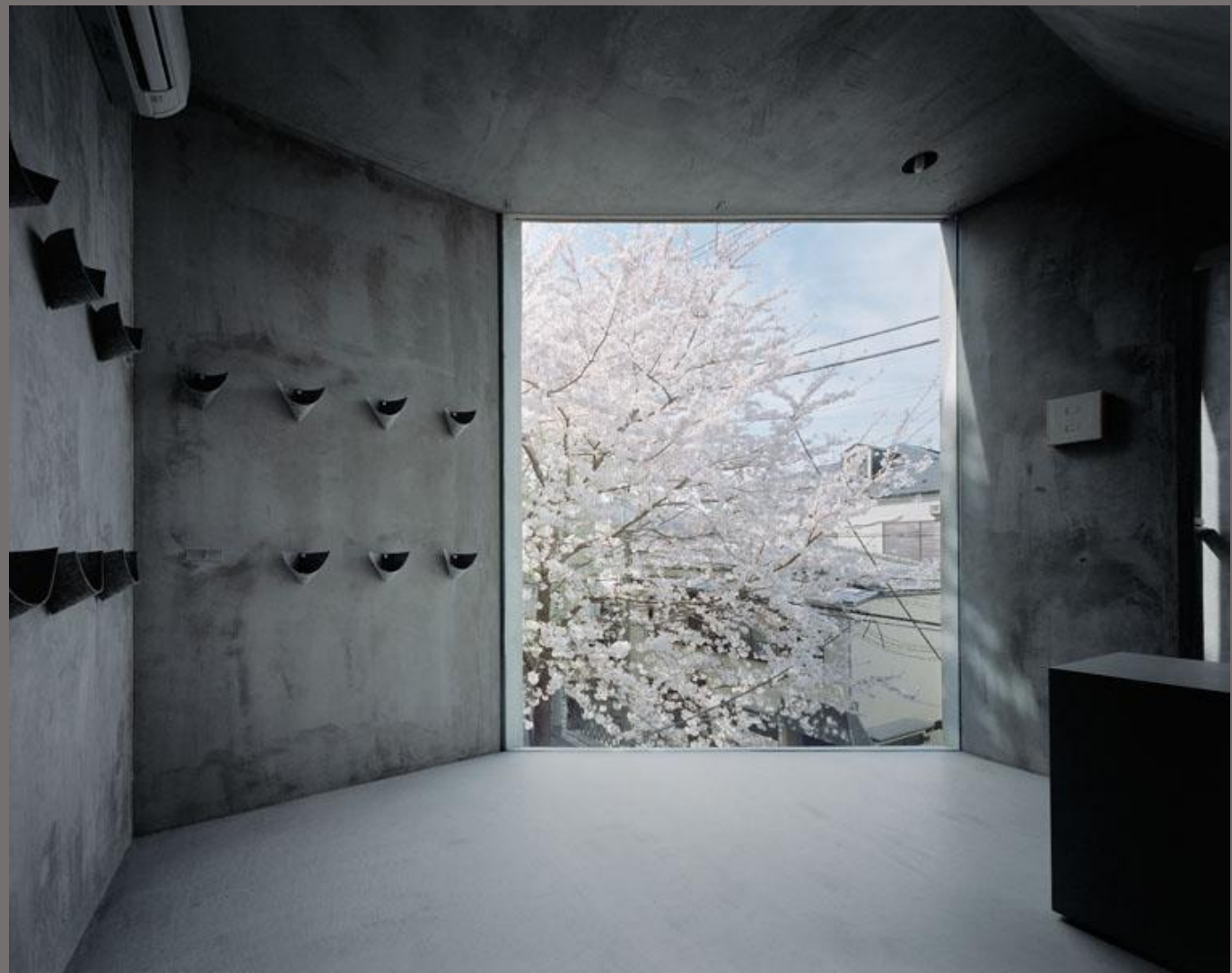
Квартира в Японии

Хорошо подчеркивает индустриальный, аскетический характер квартиры.