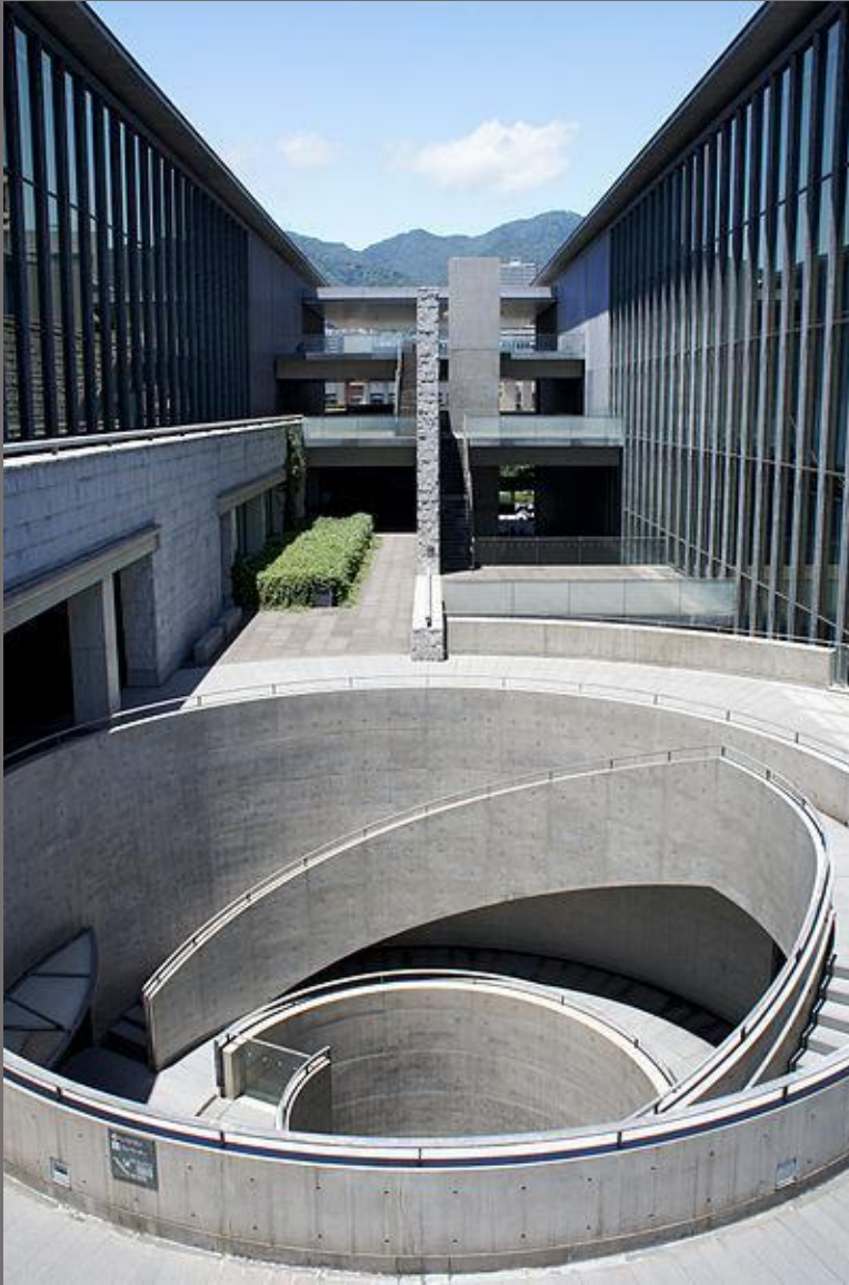
Художественный музей префектуры Хего, Кобэ, архитектор Тадао Андо

А знаменитый японский дизайнер Тадао Андо называл его «мрамором XXвека».