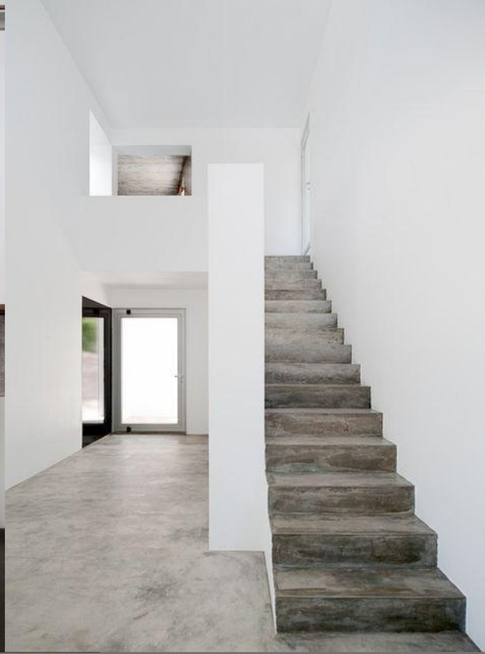
Бетон нашел свое место и в проектировании лестниц