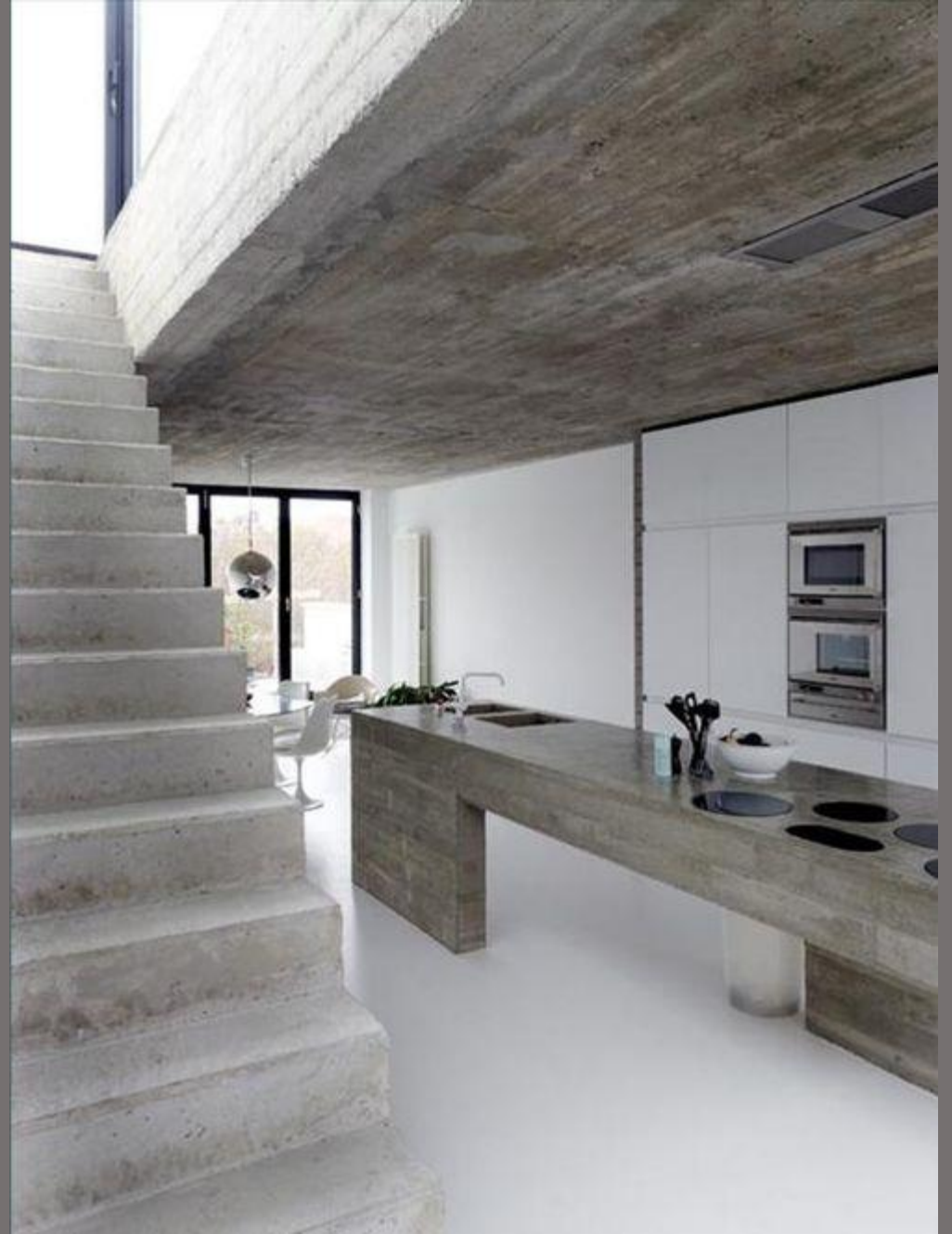
Примеры кухонь с аналогичным решением.