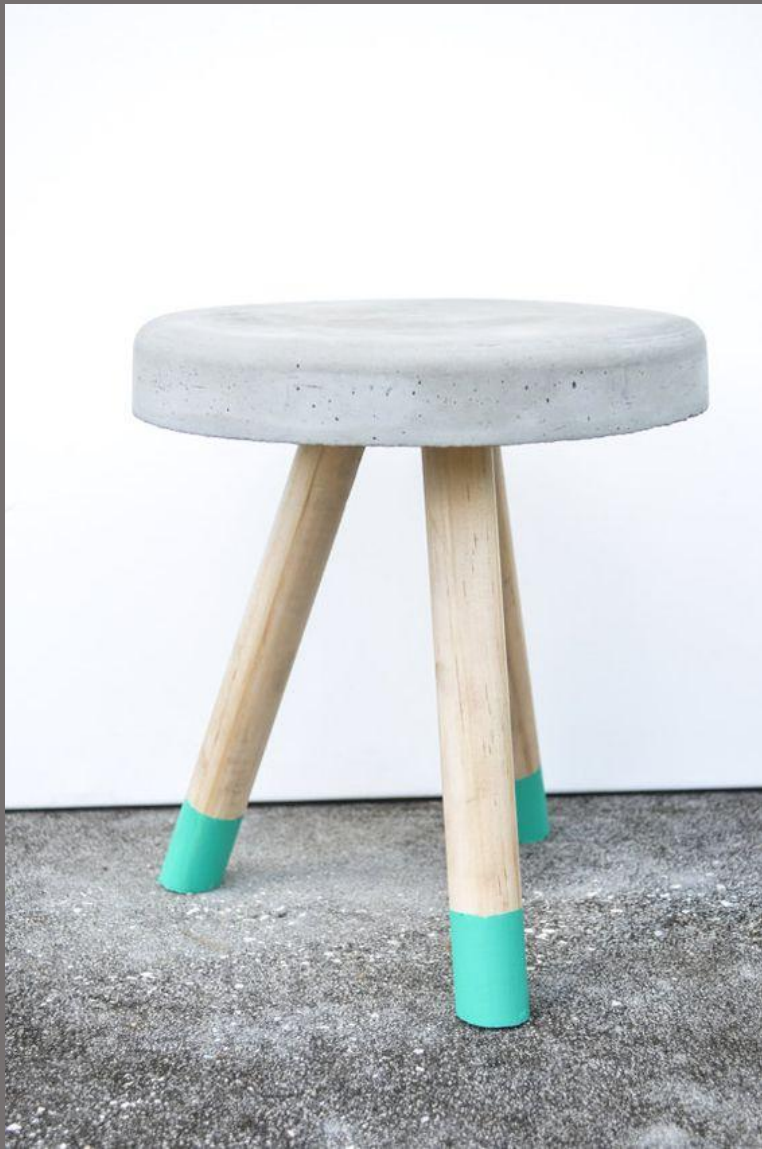
Предметы мебели, посуда