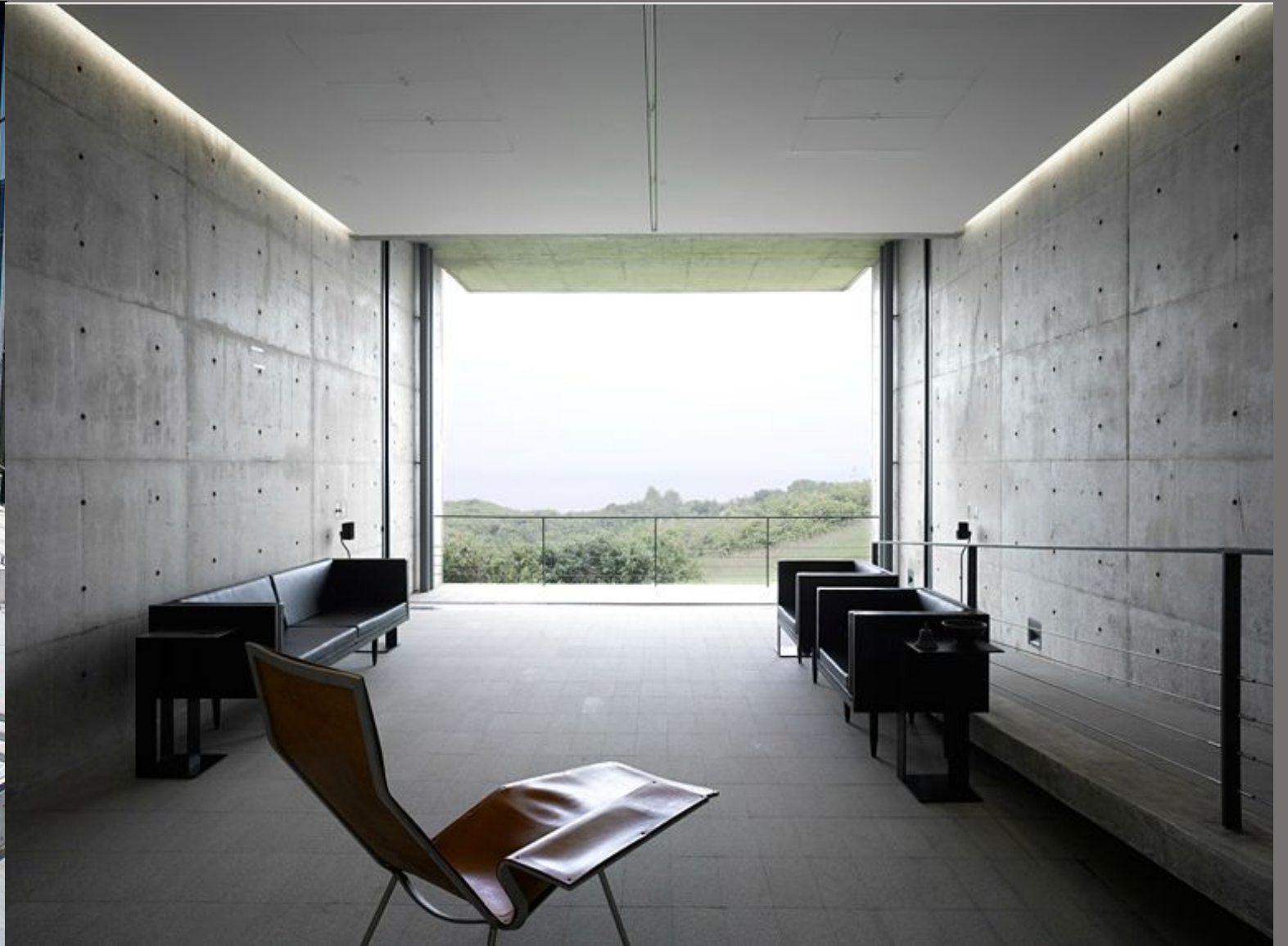
Дом в Шри-Ланке по дизайну Тадао Андо