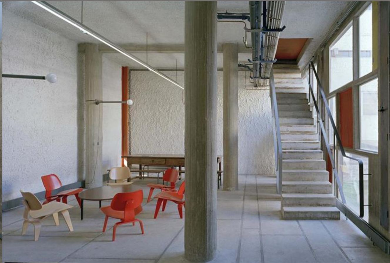
Монастырь Sainte Marie de La Tourette, Франция. 1953-1960 Ле Корбюзье