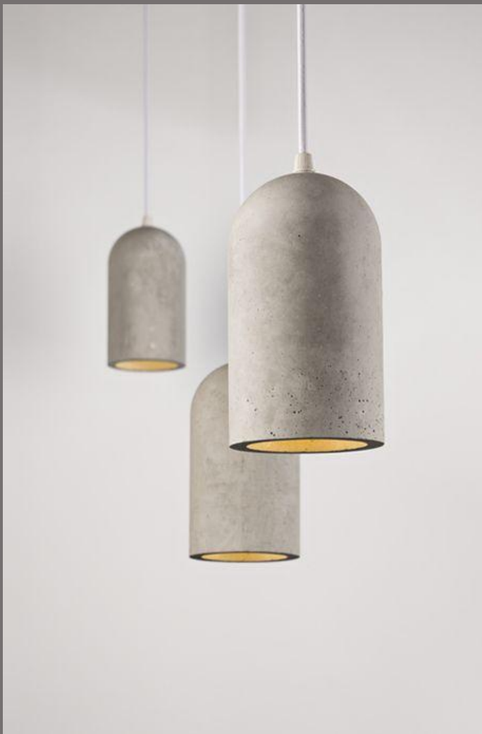
Бетон в световом дизайне