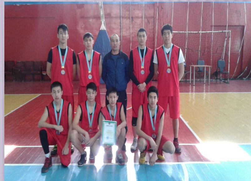
Облыстық баскетбол жарысынан 2-орын