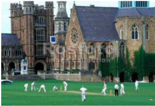
Игра в крикет