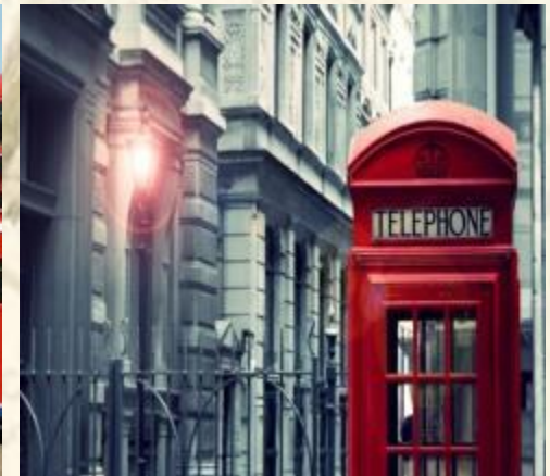
Красные телефонные будки