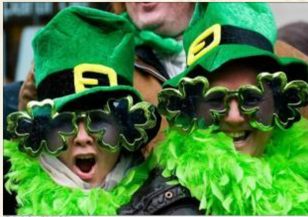
День Святого Патрика