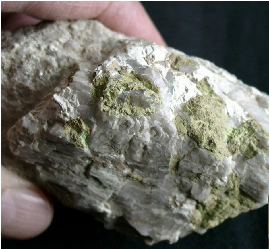
По станнину. Примагаданье