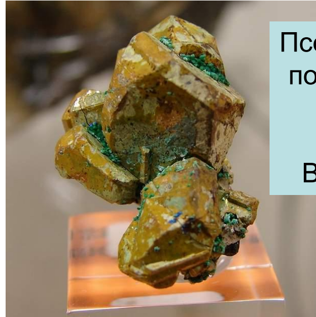
Псевдоморфозы по кристаллам кёстерита. Кёстер, Вост. Якутия