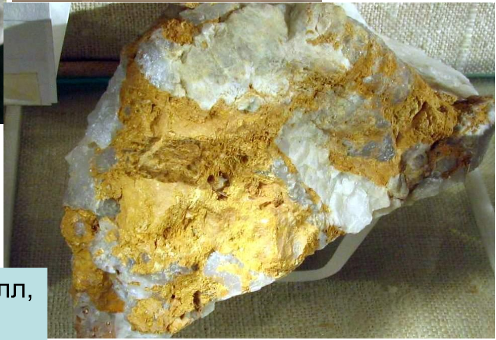
Gunheat Pit, Сент-Остелл, Корнуолл, Англия