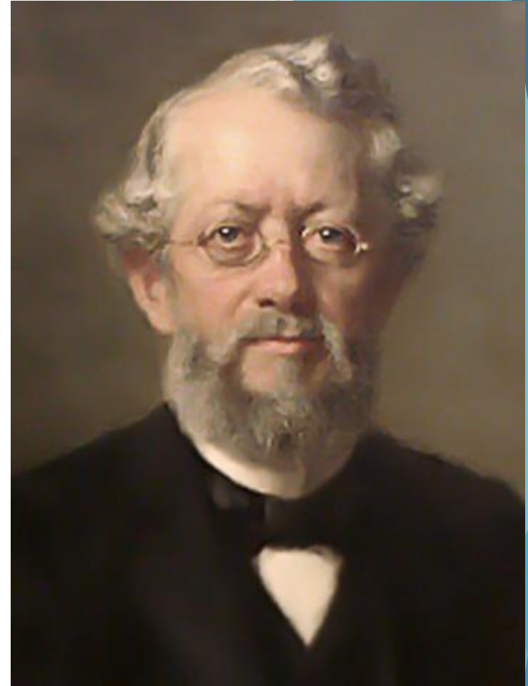
Карл Август Мебиус (1825-1908)

Термин «биоценоз» ввел немецкий гидробиолог Карл Мебиус в 1877 году