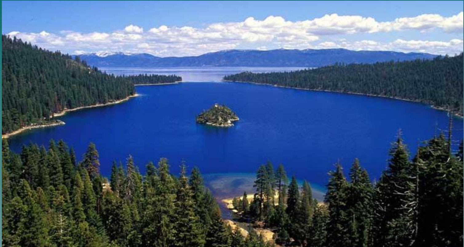
Озеро Тахо в Калифорнии