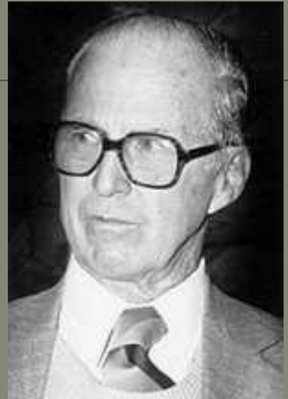
Норман Э. Борлоуг, лауреат Нобелевской премии мира 1970 г., президент Всеафриканской ассоциации Сасакава

Этот ученый-селекционер — один из самых известных людей в мире. Он спас от голодной смерти столько людей, сколько не удавалось до него никому. Его считают отцом «зеленой революции».