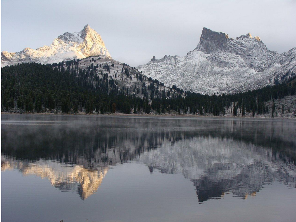
Пик Звездный, 2265 м.н.у.м., 12 июля 2011 года.