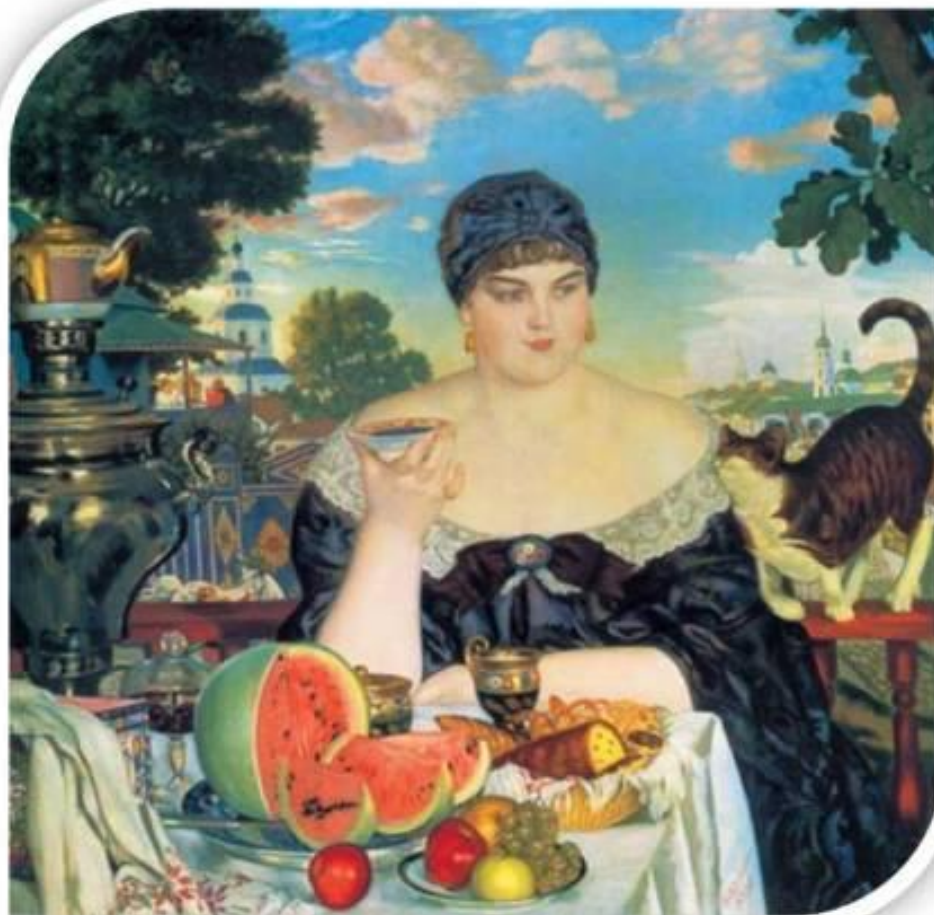
Кустодиев Б.М. «Купчиха за чаем»