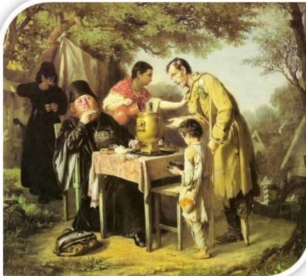
В.Г. Перов. «Чаепитие в Мытищах»