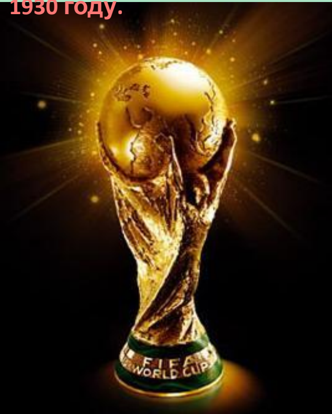
Кубок мира по футболу(ФИФА) 1921г.

После избрания Жюля Римэ президентом ФИФА в 1921 году было ратифицировано предложение считать последующие Олимпийские футбольные турниры «чемпионатами мира по футболу среди любителей». Эти турниры — 1924 и 1928 годов — выиграла сборная Уругвая. Благодаря этим успехам у Ассоциации футбола Уругвая не было конкурентов в борьбе за организацию первого в истории Кубка мира ФИФА (более известного в русском языке просто как чемпионат мира по футболу), который прошёл в 1930 году.