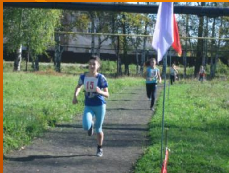
Школьная спартакиада «Мои ступени»