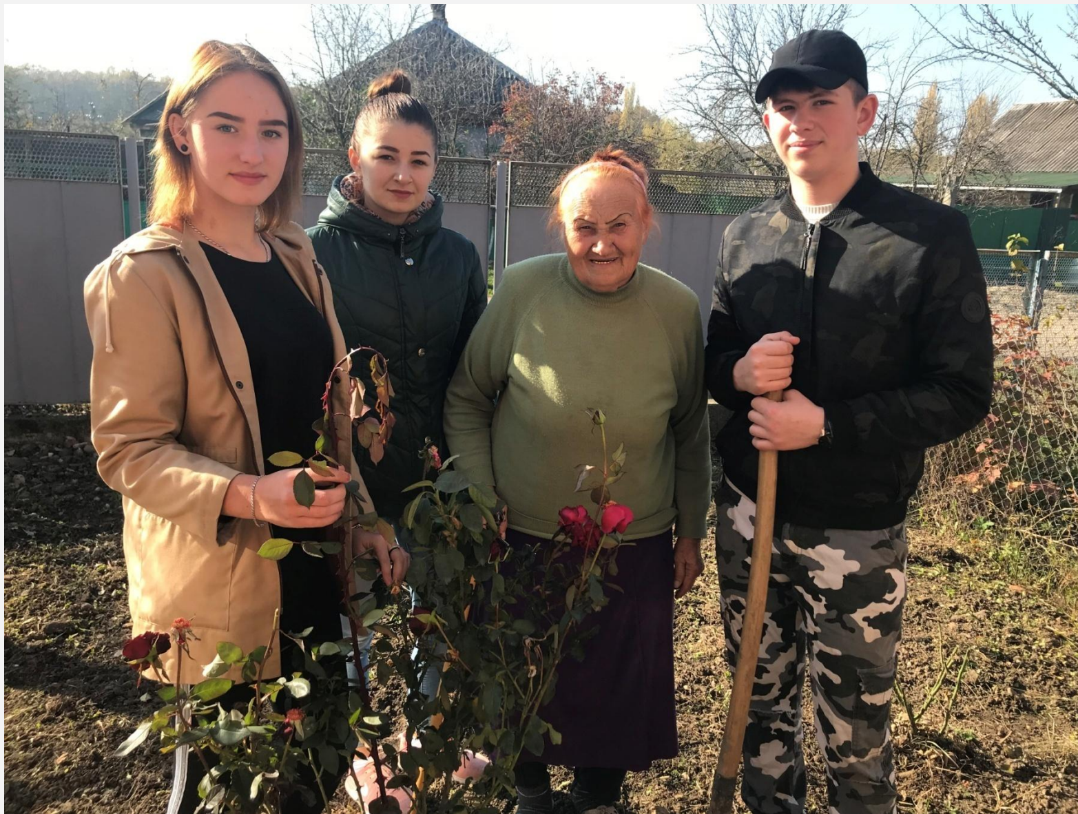
Эковолонтеры, участники Акции «Зеленый ветер»