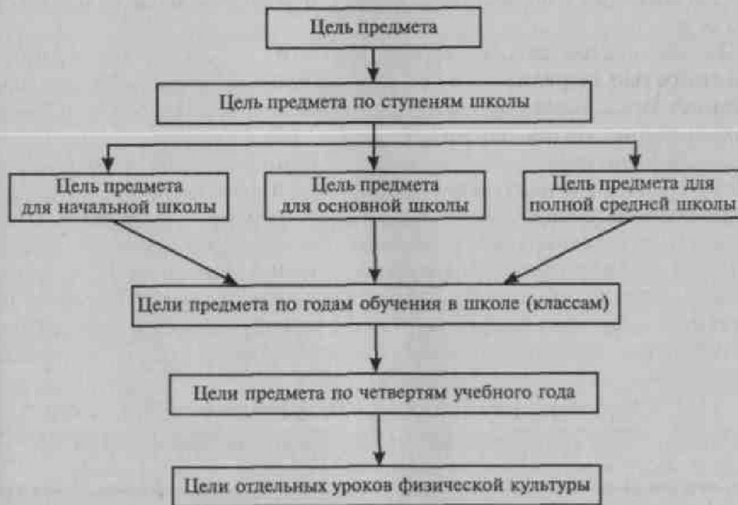
Рис. 16. Логика целеполагания в технологии дидактических процессов по физической культуре в общеобразовательной школе