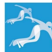
Short Track Speed Skating