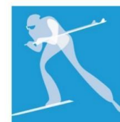
Cross Country Skiing